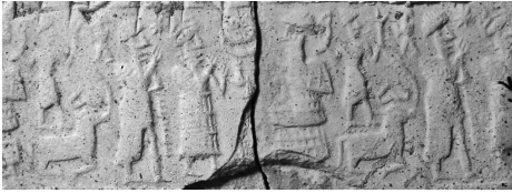
Empreinte du sceau de Tariša sur l'enveloppe Kt 93/k 372+380

ci-dessus). Celles dont des fragments d'enveloppes ont été découverts portent l'empreinte du sceau de Tariša.