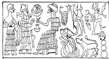
Sceau de Waqqurtum

Le sceau de Waqqurtum est également connu, il se trouve sur la moitié d'une enveloppe de lettre expédiée à Puzur-Aššur ; la lettre elle-même a disparu 30 . Ce même sceau figure sur une enveloppe fragmentaire sur laquelle on peut lire deux noms propres partiellement détruits, mais pas Waqqurtum 31 . De style paléo-assyrien, il présente un adorant devant un dieu.