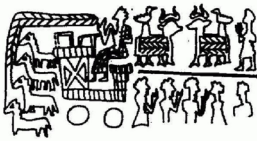
Sceau utilisé par Walawala

Une enveloppe intacte d'une créance porte quatre scellements. Le quatrième provient d'un sceau-cachet en forme de bouton à quatre trous ; il aurait été apposé par la débitrice, Ninni, qui a emprunté à un Assyrien 21 sacs de blé et 20 sacs d'orge, à rembourser au moment de la moisson 36 .