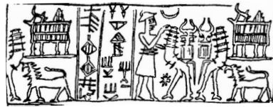
Sceau utilisé par Šatahšušar