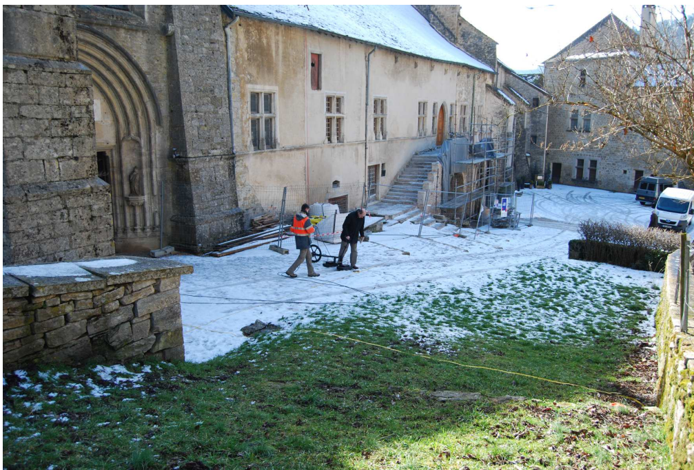
Fig. 1 - Baume, prospection géophysique sur le parvis de l'ancienne abbatale.