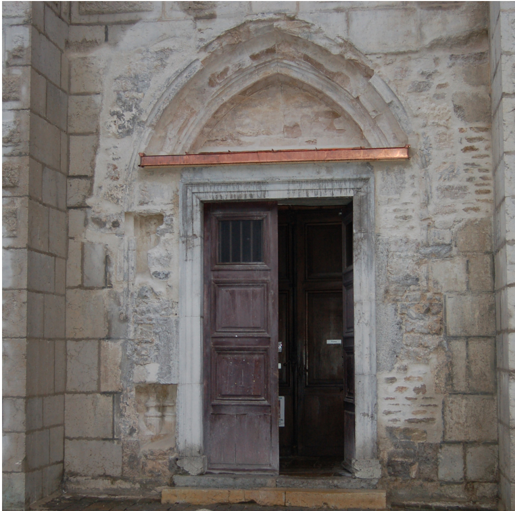
Fig. 3 - Saint-Claude, ancienne abbatale (cathédrale), portail gothique après le démontage partiel du portail moderne (cl. R. Le Pennec, APAHJ, 2005).