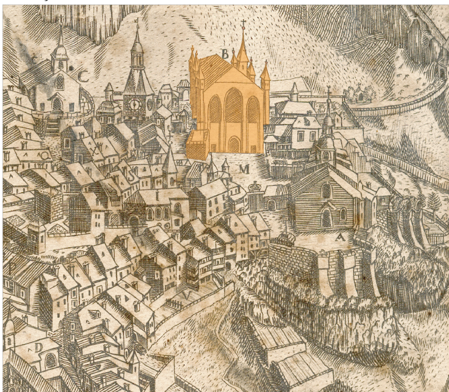
Fig. 2 - Saint-Claude, ancienne abbatiale (cathédrale), détail de la vue cavalière de Tournier, vers 1718.