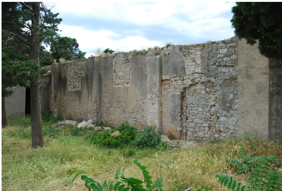
Fig. 1 - Saint-Pierre d'Ilovik, sondages dans les enduits du mur sud : découvertes des baies.