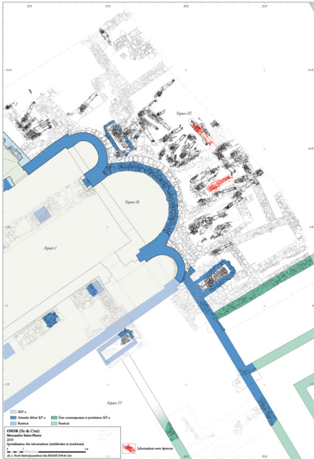
Fig. 1 - Osor, relevé des inhumations au chevet de l'église (dessin L. Fiocchi, D. Vuillermoz et équipe de fouille).

temps, la présence de femmes et d'enfants révèle un recrutement paroissial. Parmi celles-ci, se distinguent quatre sépultures dotées d'éperons que l'on date à partir du XII e siècle (fig. 1). Trois de ces inhumations ont été découvertes en 2008, une quatrième l'a été cette année. Le personnage a été inhumé en cercueil : deux boucles de vêtement étaient disposées au niveau de la tête fémorale droite et une troisième reposait entre les coxaux. L'unique éperon, situé au pied droit, est d'un type à mollette à cinq points, que l'on date à partir de la seconde moitié du XIII e siècle.