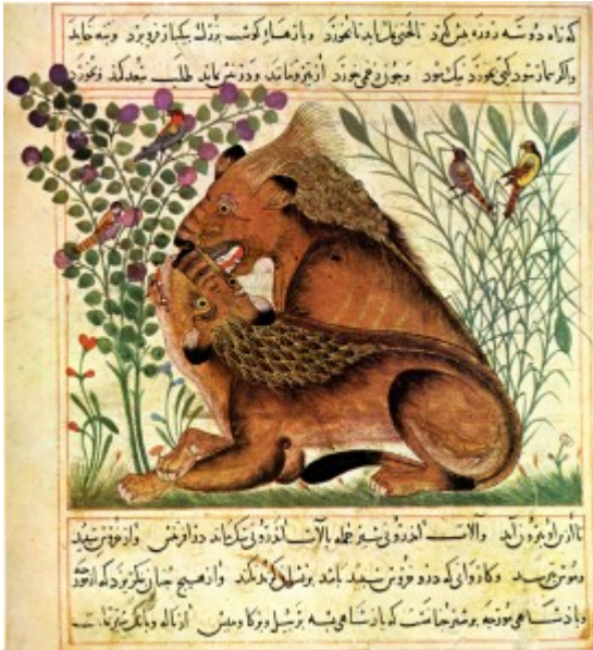
Lions (Manāfi' al-ḥayawān, Perse, Maragha, fin du XIII e s., Pierpont Morgan Library)

La grande faune sauvage, aujourd'hui disparue en Syrie, était présente au Moyen Âge dans la région : les fauves prédateurs tels que le lion ( al-asad ), la panthère ( al-namir ou al-nimr ) et le guépard ( al-fahd ) 1 étaient encore relativement nombreux et à l'occasion décimaient les troupeaux et terrorisaient les populations. Lions et panthères étaient chassés selon diverses techniques, dont nous avons plusieurs témoignages dans les mémoires d'Ibn Munqid̄ (prince syrien mort à Damas en 1188) ou dans le traité de chasse d'Ibn Manglī (1371, compilation d'ouvrages cynégétiques plus anciens).