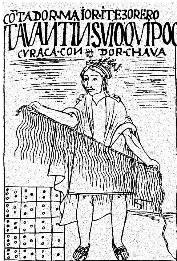
FIGURE N°2 : KHIPU ET PIERRES COMPTABLES, D'APRÈS GUAMAN POMA DE AYALA

El aprendizaje de la escritura exigió de parte de los Andinos una readaptación del conjunto de los « artes de la memoria ». Observaremos de que manera las tradiciones orales, los kipus y las quellcas (dibujos) pero también el culto a los muertos - que desempeñaba un papel importante para el conjunto de la sociedad - fueron el objeto de un intento normativo a raíz de la evangelización. Este esfuerzo iba al par con una novedosa política lingüística en vista de favorecer la evangelización. Este artículo estudia como los Indios aceptaron y entendieron las nuevas técnicas de memorización impuestas.