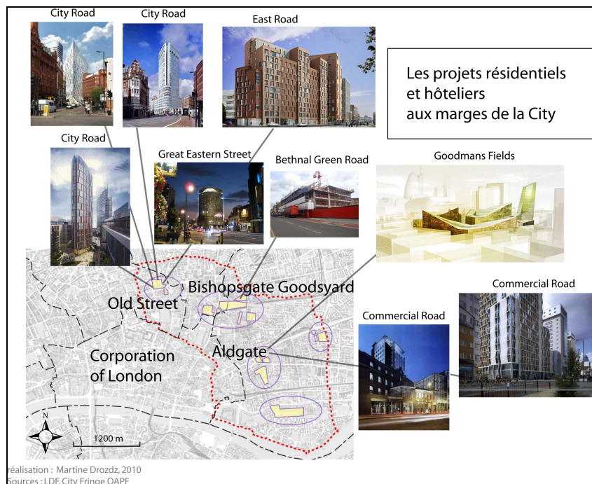
Fig.4 Nouveaux paysages résidentiels dans les franges nord-est de la City