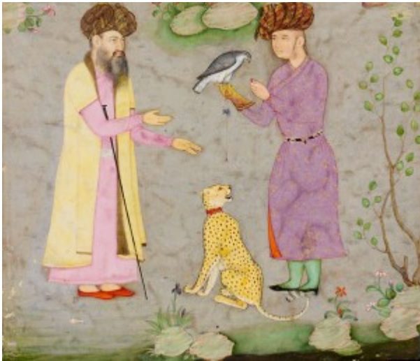
Fauconnier et guépard apprivoisé (dét.), Inde du Nord, c. 1610-1615, Londres, Victoria and Albert Museum, IS.48:37/B-195