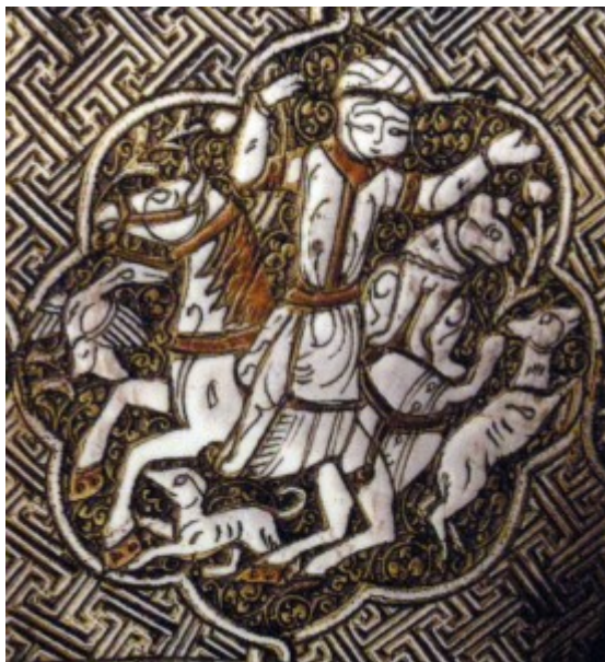
Chasse à cheval, avec guépard assis derrière le cavalier. Aiguière Blacas (détail), vers 1232, Irak, Mossoul. British Museum, ME OA 1866.12-29.61

Les connaisseurs déclarent que les guépards de la Samāwa sont les meilleurs pour la chasse en battue fermée ( halqa ), alors que ceux d'Égypte leur sont supérieurs en courre libre, mais moins beaux de robe. Les guépards égyptiens ont un port plus altier et sont plus allongés de corps, ce qui leur permet d'entreprendre la gazelle dorcadé, tandis que ceux de la Samāwa ont des lignes plus gracieuses. La plupart de ces derniers ont la robe blanchâtre aux mouchetures rares, le corps svelte et les membres effilés ; chez eux, le mâle est meilleur preneur que la femelle, mais celle-ci reste de beaucoup la plus belle de toute l'espèce et elle se montre infatigable à la course ; il se trouve même certaines femelles capables de tenir le train après les gazelles une journée entière. Ces guépards ont longue échine et longue queue ; haussant le col pour aveuer[1], on les prendrait pour des marionnettes, se retournant, leur échine se love comme un serpent et leur queue, dressée, rappelle une lance. C'est, certes, de toutes les races, la plus belle, la meilleure pour le courre et la plus digne de louanges.