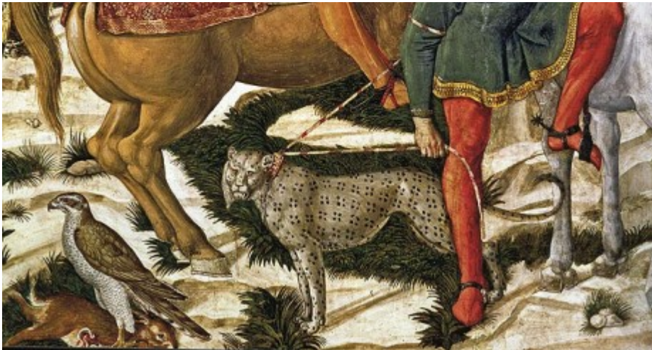
Benozzo Gozzoli, Procession des Mages (détail), 1459, Florence, Palazzo Medici-Riccardi, Cappella Medici