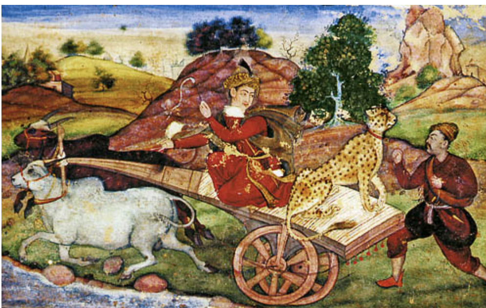
Vers 1600.