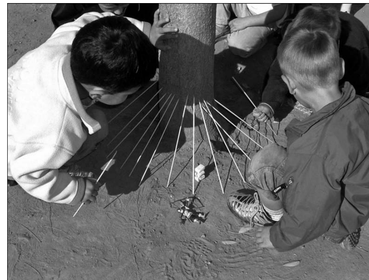
1. L'école en perspectives.

Terrain glissant... Parler d'École de nos jours, c'est prêter le flanc à des réactions immédiates. Partisans des savoirs ou de la pédagogie, de l'école sanctuaire ou de l'école ouverte, de l'autorité supérieure incontestable ou de l'autorité légitime conquise par le dialogue... les débats se cristallisent sur des oppositions franches. Dans les vitrines les plus exposées (tribunes politiques, médias), il faut choisir son camp, tant l'école fait objet de passions et d'enjeux. La même injonction peut surgir à l'échelle plus discrète du privé et du quotidien : du repas de famille au café entre amis, en passant par la discussion au salon de coiffure. Impossible, semble-t-il, après tout ce qu'on voit et ce qu'on apprend par la presse ou l'entourage, de ne pas avoir de position sur la violence à l'école, les méthodes de lecture, le voile islamique, la carte scolaire . Sans qu'on sache bien si la position qu'on demande de prendre est politique, scientifique ou morale. Les énoncés sur l'école se diffusent de telle manière et si vite que ce qui est le plus attendu est une appréciation arrêtée, sans doute déterminée – ce dont on tient rarement compte – par les souvenirs scolaires et les valeurs éducatives profondes de chacun(e). Pourtant, comme d'autres institutions aujourd'hui (pensons à la famille), l'école se caractérise par la pluralité des normes et la complexité des situations. Le phénomène est inhérent au