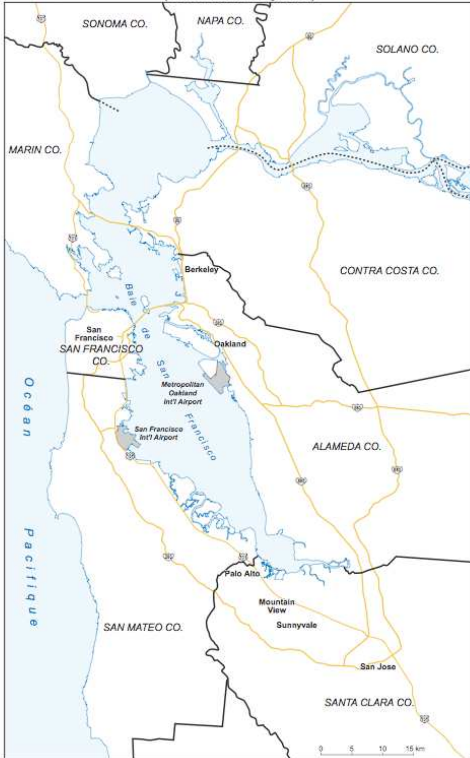
Carte 2 : James E. Vance, Geography and Evolution in the San Francisco Bay Area (droits réservés).