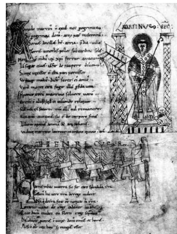
Desenhos de Bruno Baudoin, a partir do manuscrito de Londres, British Library, Add. 11662 fº 4r e 5r, (CNRS, ARTeHIS UMR 5594)

Do ponto de vista da composição geral do manuscrito, o fólio 4r se refere ao rei e ao grupo eclesiástico próximo de Saint-Martin-des-Champs (igreja, cônegos, abade, chanceler e bispo de Paris), o fólio 5r à relação estreita do santo junto ao rei no momento crucial da morte, enquanto que o fólio 5v se abre para um círculo alargado e ordenado hierarquicamente em torno do rei e conseqüentemente, da abadia que ele patrocina. Se o rei parece dominar a cena, a igreja São Martinho é que ocupa a posição mais alta. Porta aberta, interior basilical igualmente aberto, ela é o