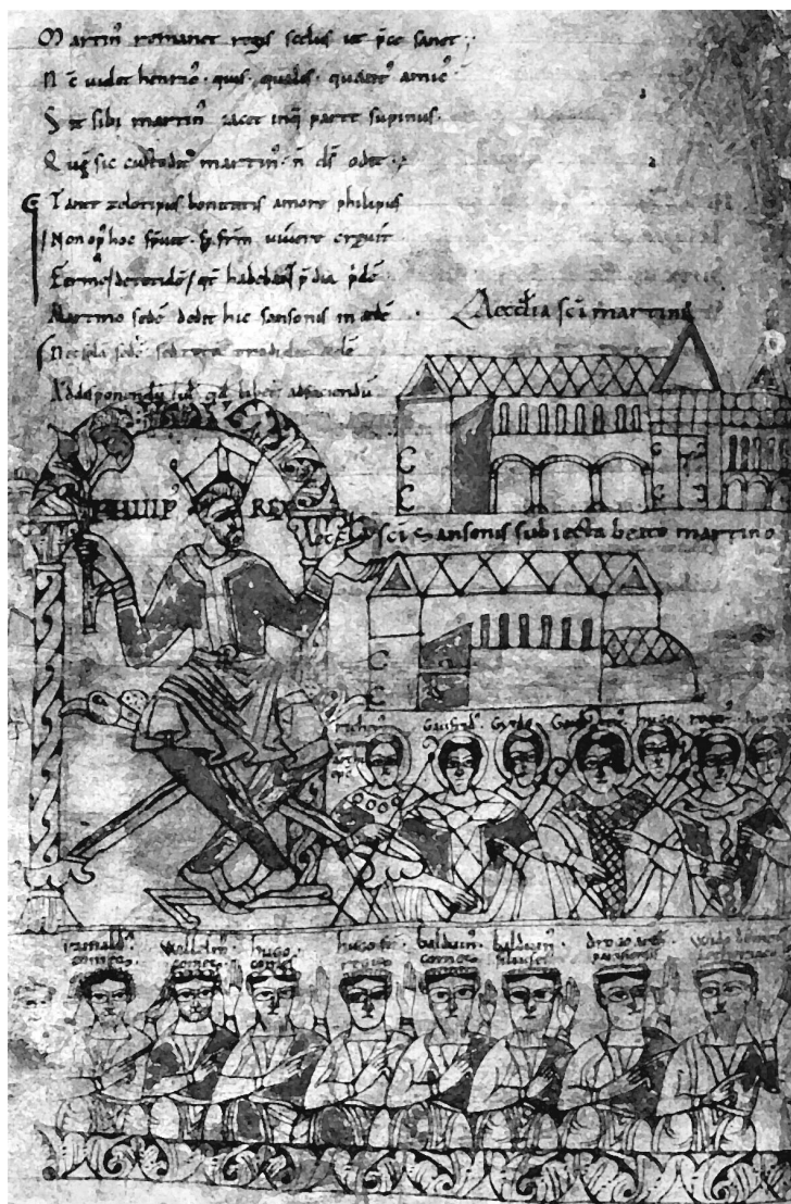
Desenho de Bruno Baudoin, a partir do manuscrito de Londres, British Library, Add. 11662 fº 5v, (CNRS, ARTeHIS UMR 5594)