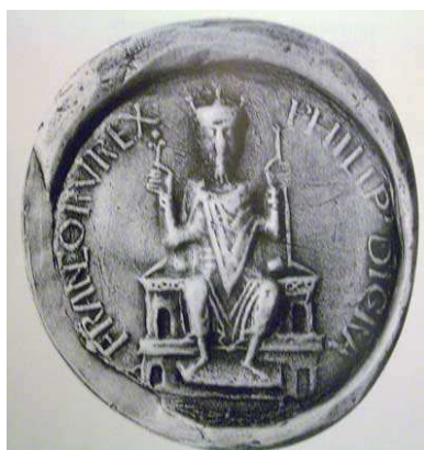
Primeiro selo do rei Felipe I (73 mm de diâmetro) – Paris, Archives Nationales, collection de sceaux D 33 (molde a partir da impressão sobre um ato do 1º de agosto de 1068, Archives Nationales, K 20 n° 4) (PHILIP(us) D(e)i GR(aci)A / FRANCORV(m) REX). Ver Corpus des sceaux français du Moyen Âge. Tome II, op. cit. , p. 142, n° 63.

A maneira como Felipe I é apresentado na crônica de Saint-Martin-des-Champs é próxima dos selos em majestade, tipo de selo que aparece no final do século X com o imperador germânico Oto III e se difunde na primeira metade do século XI 14 . Henrique I é o primeiro dos reis capetianos a adotar esta forma sigilada onde se prenuncia a configuração de uma imagem de autoridade real ou leiga. O primeiro selo de Felipe I se calca no de seu pai: sentado de face sobre um banco com dois andares de arcadas e os pés apoiados sobre um estrado, o rei, barbado e com cabelos curtos, leva uma coroa de três pontas; vestido com uma longa dalmática e um manto curto preso no ombro direito por um broche redondo e a ponta tombando no peito, ele segura uma verga florida com a mão direita e um cetro com a esquerda 15 .