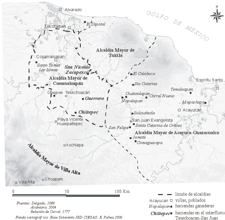
Figura 3: Principales estancias ganaderas y haciendas a fines del XVII

La situación sobre las tierras bajas más alejadas de la sierra fue completamente distinta. Ahí veríamos, todavía hasta finales del ochocientos, enormes extensiones de montes bajos y sabanas, tal vez herederos de la deforestación 10 , con hatos muy dispersos, cuyos primeros bovinos fueron introducidos desde el marquesado de Los Tuxtlas. Tales extensiones eran producto de la acumulación temprana de las sabanas a partir de la composición real de encomiendas, mercedes de tierras, estancias y sitios de ganado mayor que, para los siglos XVII y XVIII, ya formaban haciendas ganaderas en pleno auge (Alcántara, 2004; Celaya, 2005). En realidad se trató de latifundios prácticamente despoblados y cuyos dueños, siempre ausentes, al final casi perdieron en herencias olvidadas. Más cercanas a Cosamaloapan y Tlacotalpan, aunque de difícil acceso por los ríos y pantanos que les franqueaban, sus tierras nunca llegaron realmente a parecer verdaderas haciendas, es decir asentamientos caracterizados por tener habitaciones centrales -la dicha casa grande de otras partes- y anexos como molinos, bodegas, viviendas para peones; o al menos no restan vestigios visibles de ellos.