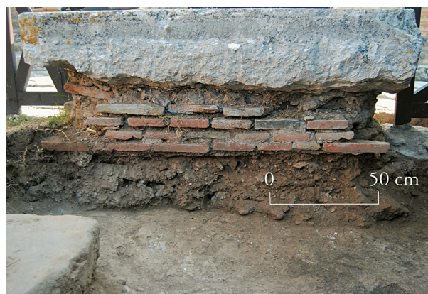
Fig. 48 – Pompéi. L'espace VII 3, 23 à Pompéi en cours de fouille. L'établi repose directement sur l'US 02 (déjà fouillée dans le reste du sondage).

Plusieurs remarques doivent être faites quant aux structures observées. En ce qui concerne le comptoir/établi, sa fondation maçonnée et appareillée de briques repose directement sur la surface de l'US 02 (fig. 48). Le bloc de travertin qui en constitue le sommet ne présente pas de traces claires de remploi. Sa face supérieure est parfaitement lissée, tandis que les autres faces ne sont