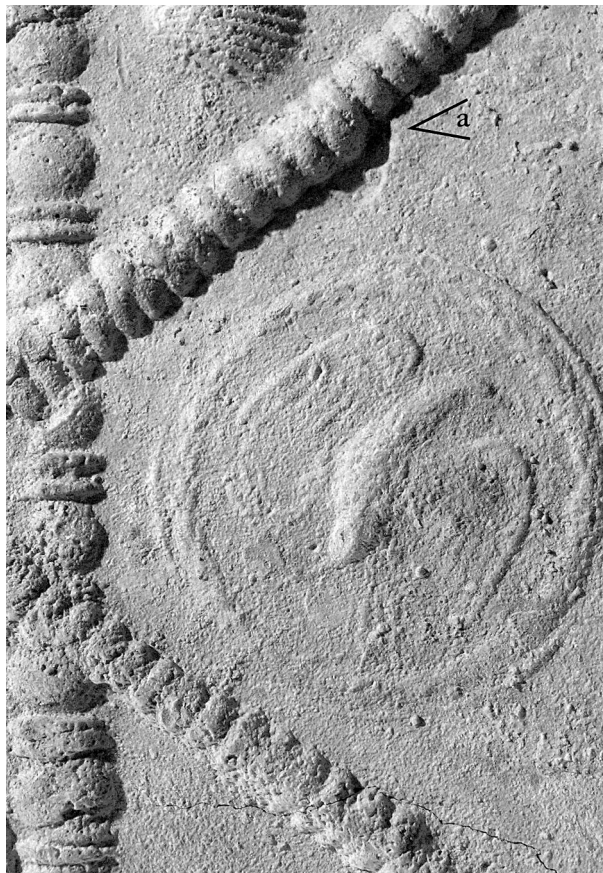
Fig. 46 – Pompéi. Détail de la ciste P-CiE-06 (Pompéi, Inv. n° 18912). Des baguettes à perles et pirouettes et à pirouettes seules ont été utilisées pour former le décor. Le léger décalage dans la succession des baguettes à pirouettes seules permet d'identifier leur longueur (a). Le médaillon représente un aigle aux ailes déployées, tenant dans ses serres un foudre (?); le motif est inscrit dans une couronne de laurier.

La formation de ces motifs en elle-même requiert un certain savoir-faire. Par définition, le moule est refait pour chaque objet, même si des outils identiques sont employés. Toutefois, une erreur dans sa confection peut entraîner des défauts de coulée – rarement observés – qui pourraient ensuite nuire à la bonne tenue de la ciste. De plus, la position occupée dans la maison par les objets fins oblige à ce que les décors, toujours visibles, soient réalisés avec soin. Si des repentirs sont parfois visibles, ils sont également très peu fréquents. Une fois la coulée effectuée, la feuille doit être cintrée et brasée avant son assemblage avec le fond pour achever la ciste. Si aucun signe de martelage n'a été observé, des aplatissements et de légères abrasions des motifs décoratifs pourraient être