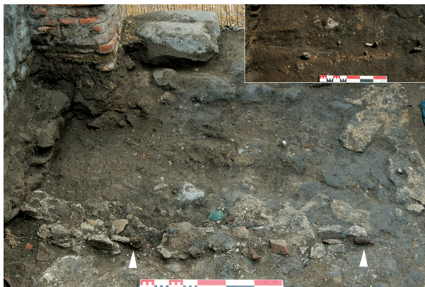
Fig. 50 - Pompéi. Crassier du second état de l'espace VII 5, 28 en cours de fouille. Au premier plan, les blocs de mortier utilisés pour bloquer les planches, fixées sur des fiches (flèches). En encadré, le sol du premier état après démontage de la paroi du crassier : seule une légèrè dépression rappelle son existence.

entre l'emploi de blocs de travertin comme établi et la métallurgie secondaire. Dans ce cas, notre hypothèse de départ paraît vérifiée. Deuxièmement, nous attirons l'attention sur la permanence d'une même activité dans cet espace : les trois états renvoient à des activités de production métallurgique. Enfin, et surtout, nous ne saurions trop souligner que, bien que situé à Pompéi, l'atelier du second état a été découvert dans des conditions « normales » de fouille – en tout cas non exceptionnelles comme pour l'atelier VI, 12 d'Herculanum. Le recours au tamisage a été systématique, à peine les premiers « macro-fragments » de plomb dégagés. Une telle pratique, pourtant élémentaire, pourrait, par une mise en œuvre plus fréquente, permettre de multiplier les découvertes d'ateliers voués à la métallurgie du plomb.