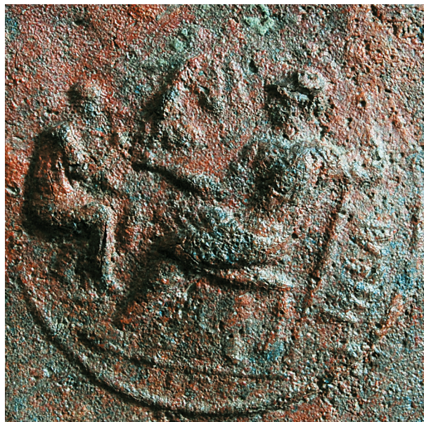
Fig. 47 – Pompéi. Détail d'un médaillon représenté sur la ciste E-CiE-01 (Inv. n° 75740, ex E463) provenant de la Casa dell'Atrio a Mosaico d'Herculaneum (IV, 01 – 02). Au centre, Minerve Erganè assise, en appui sur une lance et tenant dans sa main droite une statuette de Victoire porteuse de couronne; à gauche, un artisan (forgeron?) assis lui fait face. À droite, l'inscription mentionnant [L. Clodius] Hilarius.

Les parallèles les plus évidents de ces médaillons sont constitués par les revers monétaires : certains en