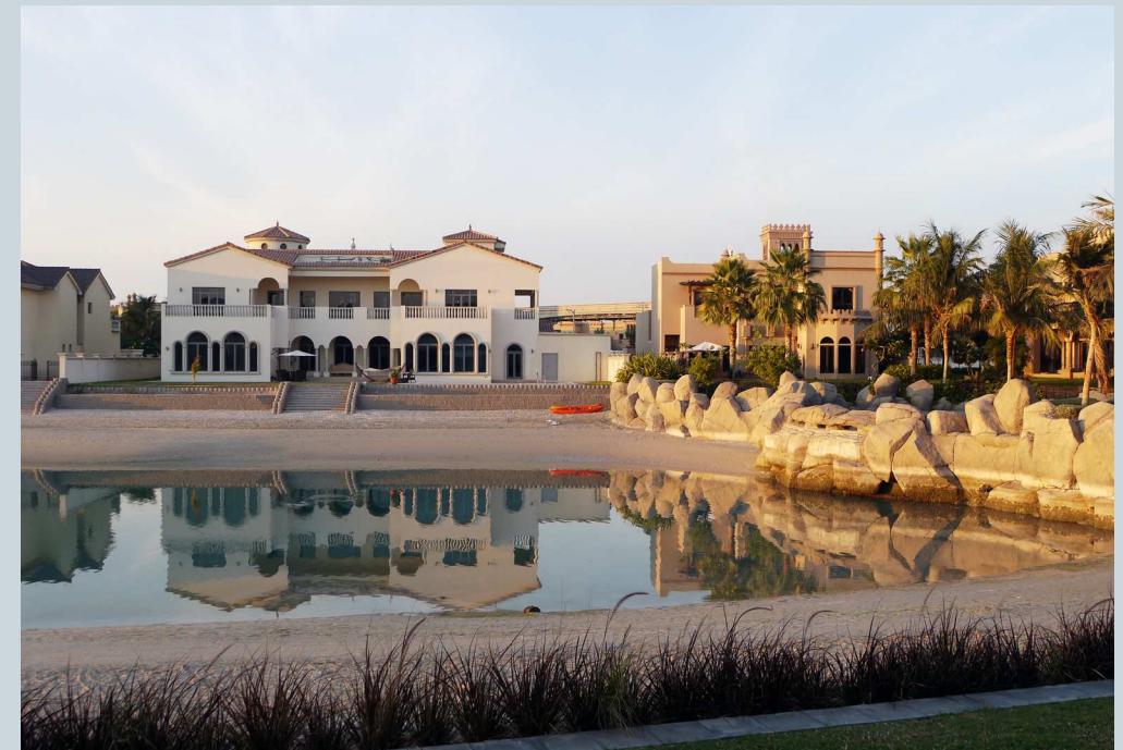
Palm Islands, Dubaï

Urbanisme sécuritaire et désir d'entre-soi