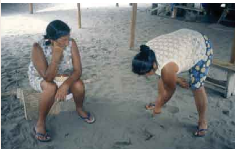
Échange entre potières (Coswine, 2001.)

yainali mes mains ( y- : première personne).