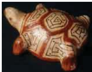
Tortue wayami façonnée par Theresia Langaman, à Galibi, en 2000 ; figurine aujourd'hui conservée au Musée national de Céramique à Sèvres.

Les autres lettres vont se prononcer approximativement comme en français, s comme s de sel , w comme w de watt et y comme y de voyage .