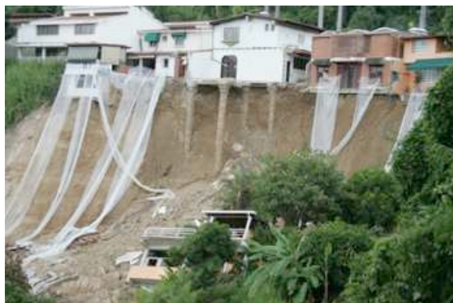
Foto 4: Deslizamiento en Santa Inés, Municipio Baruta ( El Universal 11 janvier 2006)

2- Las condiciones de vulnerabilidad han sido mencionadas en las características de la organización de las Naciones Unidas. La localización de los barrios sigue un mecanismo de exclusión socio-espacial vinculado con la renta del suelo urbano y la ausencia de regulación pública en la ocupación y la comercialización del suelo, concentrando a los “invasores” en terrenos de baja calidad, poco interesantes para el mercado (en la gran mayoría de los casos) y expuestos a las amenazas naturales. Sin embargo existen numerosas urbanizaciones ubicadas en fuertes pendientes, tan expuestas como muchos de los barrios . Y si una quinta resulta ser más resistente que un rancho, ninguna de las dos viviendas aguanta a la hora de un deslizamiento (Rebotier, s.d.b).