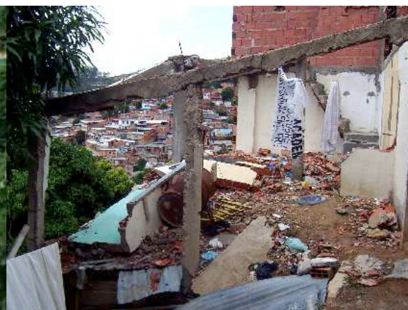
Foto 5: Deslizamiento en Mario Briceño Irragory, Municipio Libertador

Los sectores más peligrosos en términos de amenaza sísmica corresponden a sectores de clase media-alta, muy “formales”, en el centro Este de la ciudad (Rebotier, 2008)... A nadie se le ocurre hablar de asentamientos “informales” en estas situaciones.