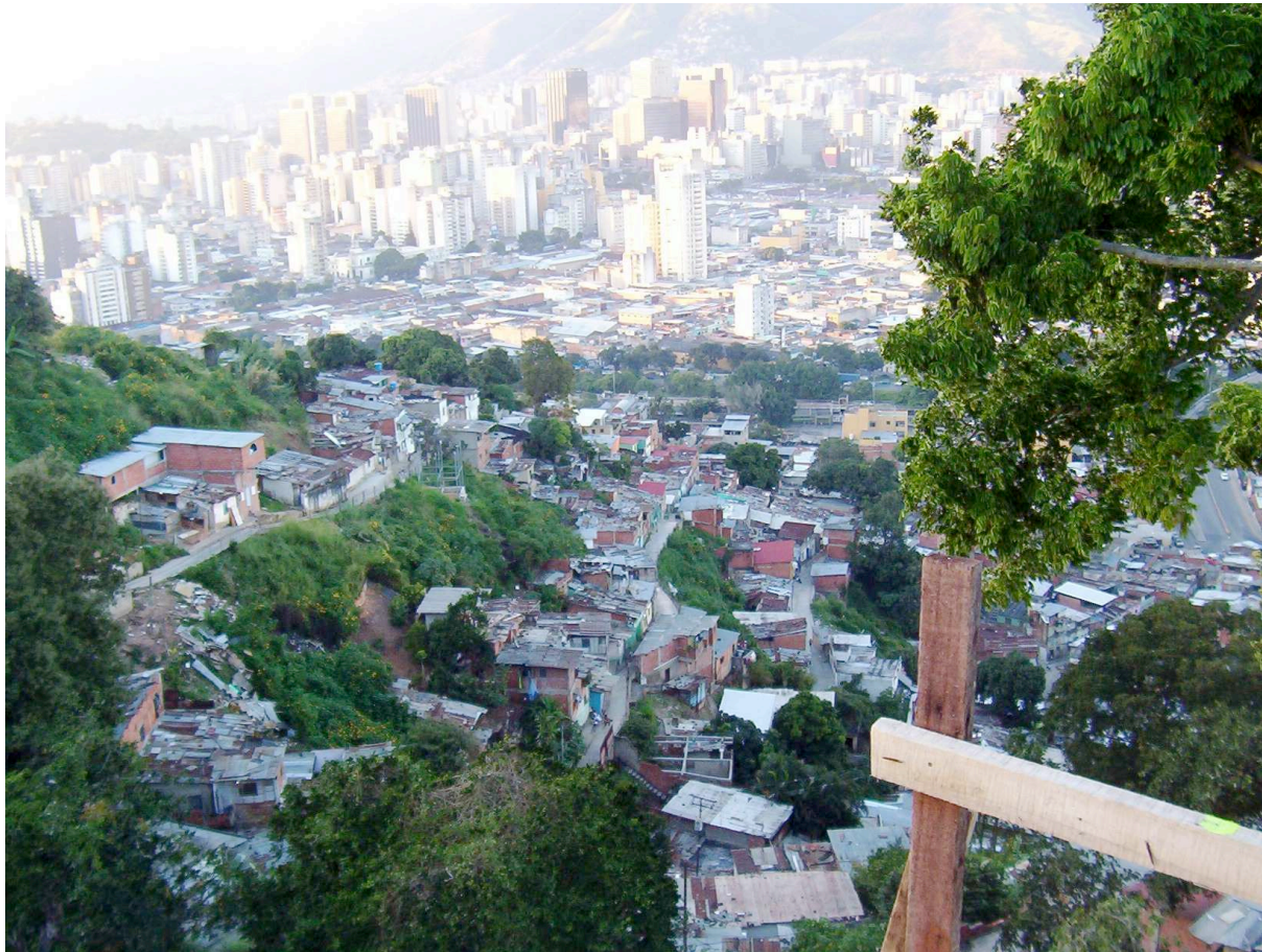
Foto 3: Centro de Caracas, desde El Mango – San Agustín

Una de las características de los asentamientos informales en Caracas, es que ocupan terrenos invadidos. En esta perspectiva, para la UN-Hábitat, los principales problemas hoy día consisten en la ausencia de planificación, en la ausencia de forma legal para asegurar la ocupación de los terrenos, en la poca o nula inclusión de los sectores a la política urbana local y en la falta de servicios urbanos, así como en la estigmatización o vulnerabilidad de su población (Durand-Lasserve, 2006).