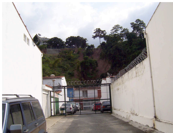
Foto 2: En la urbanización Santa Inés, Municipios Baruta – Caracas

Varias modalidades de respuesta local a la inseguridad se “formalizan” mediante nuevos mecanismos de gobernanza metropolitana (Rebotier, s.d.a), siendo eminentemente dinámica la noción de informalidad. El ejemplo de las respuestas (in)formales a la inseguridad urbana resultará muy convencedor a la hora de adoptar una perspectiva instrumentalista y politizada de la informalidad, siguiendo una analogía con la construcción de la inseguridad, del riesgo, del sujeto (chivo expiatorio) o del sector peligroso (Douglas, 2001).