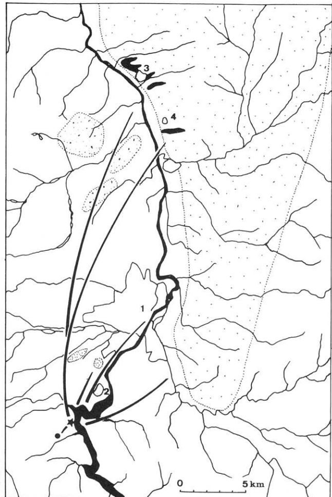
Fig. 1 – Sources d’approvisionnement en matières premières régionales (d’après les cartes géologiques BRGM n° 672 et n° 648 au 1/50000 et la carte routière Michelin n° 73 au 1/20000).