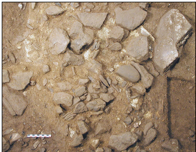
Fig. 5.– Décapage de la partie haute de C 4 d1 (Normand, 2005, photo 9). L'outil sur galet Ist 05 C4 d1 W1 29 n° 143 est bien visible au centre du cliché.

Il est teinté de traces d'oxydes noir (fer ou manganèse ?) disséminées un peu partout sur sa surface, comme beaucoup de pièces provenant de cet ensemble inclus dans un sédiment brun-rouge. Il est bien visible sur une des photos du décapage de la partie haute de la couche (fig. 5).