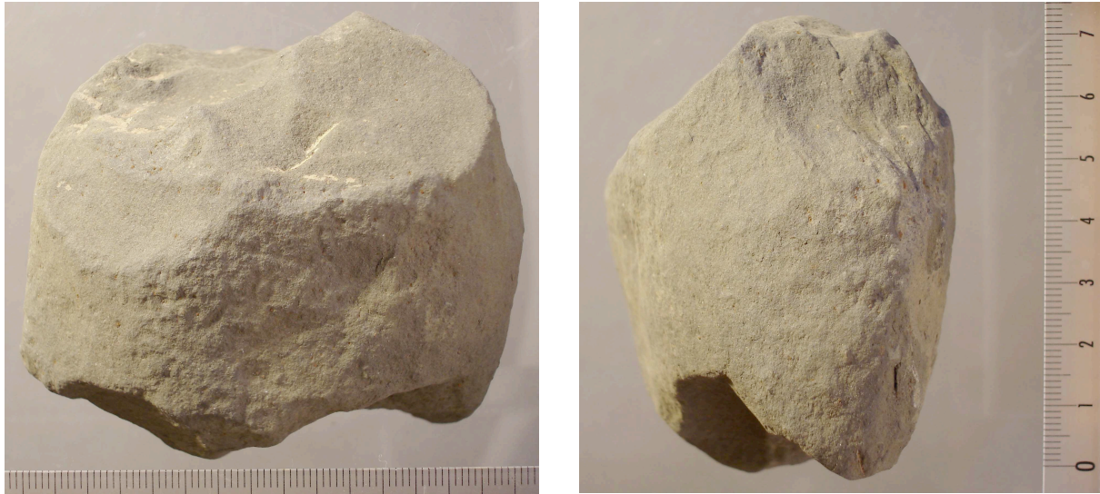
Fig. 7.– Ist 04 C4 Ib Y1 36i n° 92