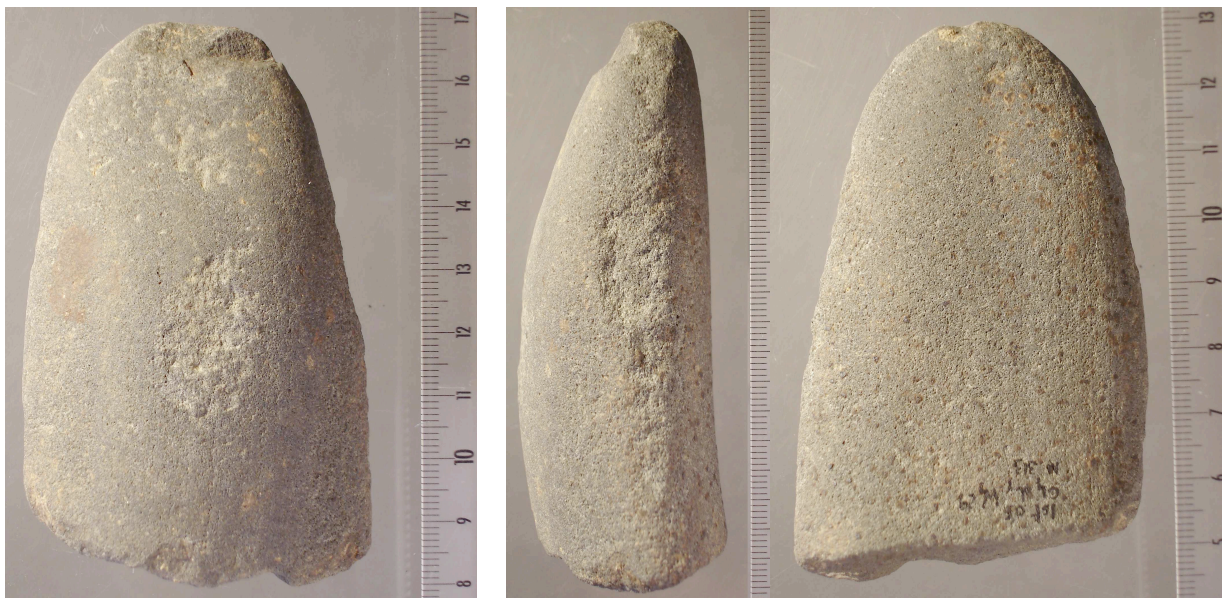
Fig. 3.– Ist 05 C4 d1a W1 29 ei T3 n° 313

L'ensemble C 4 d1a a livré deux galets portant des traces d'utilisation. Le premier est un grand fragment de galet allongé en quartzite de 95,4 x 59,4 x 34,3 mm pesant 284 g (fig. 3). Il porte d'abondantes traces d'impact sur l'extrémité opposée à la cassure, sur ses deux flancs et au centre d'une des faces. Il a donc servi de percuteur et d' enclume .