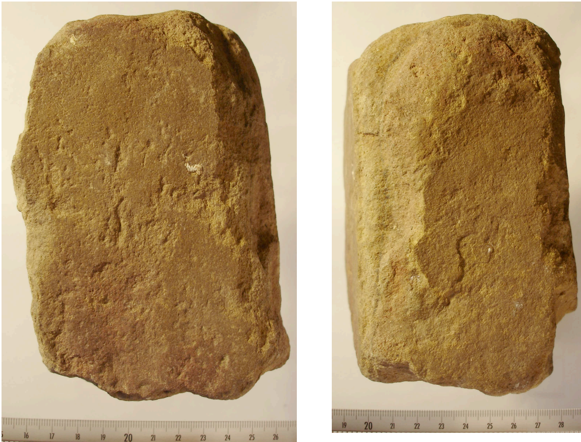
Fig. 11.– Ist 05 S8 n° 26

Ce gros fragment de bloc de grès a une forme quadrangulaire et mesure 156 x 92,4 x 94,7 mm (fig. 11). Il ne pèse pas moins de 2 290 g.