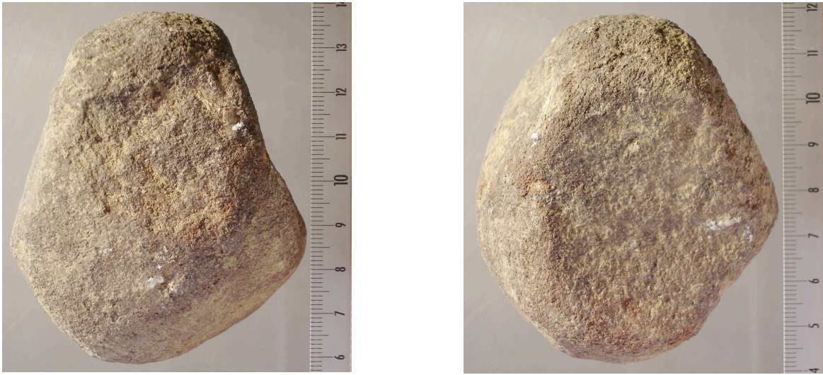
Fig. 10.– Ist 05 S8 n° 25