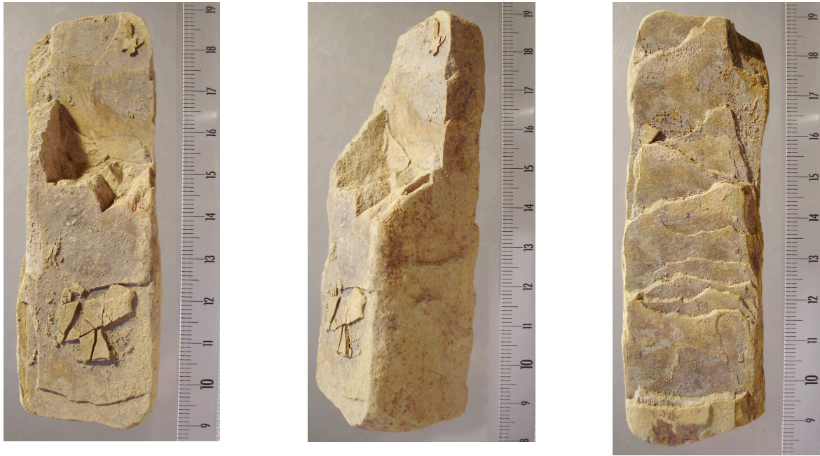
Fig. 2.– Ist 04 C 4 c6 Y1 31a 72/82 n° 11