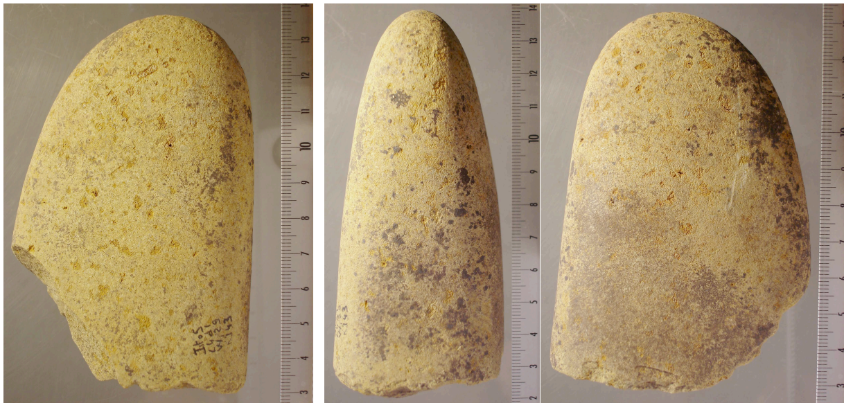
Fig. 4.– Ist 05 C4 d1 W1 29 n° 143

Le second outil sur galet provenant de l'ensemble C 4 d1a a une forme proche du précédent (fig. 4). Il s'agit là aussi d'un grand fragment d'un galet allongé en grès quartzite à peu près de la même dimension : 109,6 x 75,5 x 49,4 mm pour un poids de 546 g. Il porte des traces d'impact légères sur l'extrémité intacte et a donc servi accessoirement de percuteur .