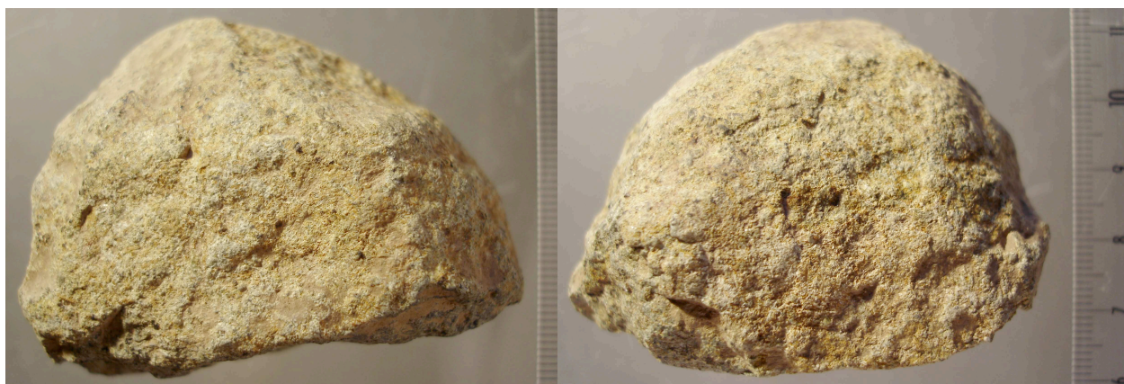
Fig. 6.– Ist 04 C4 Ib Y1 36i n° 89

Il s'agit d'un petit fragment de galet d'ophite de 44,5 x 61,7 x 52,1 mm pour un poids de 204 g (fig. 6). Il porte de nombreuses traces d'impacts et d'écrasement sur son extrémité intacte, ce qui indique un usage en percuteur .