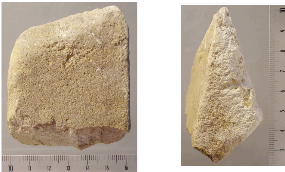
Fig. 9.– Ist 05 S8 n° 24

Ce petit fragment de dalle en grès de 69,4 x 64,9 x 34,8 mm pèse 190 g. Il a une forme trapézoïdale et sa face supérieure est plane (fig. 9). Sa section est triangulaire en raison d'une cassure dans l'épaisseur même de la plaquette. Il porte quelques traces d'impact bien circonscrites sur une partie de la face supérieure. Il peut s'agir d'un fragment d' enclume .