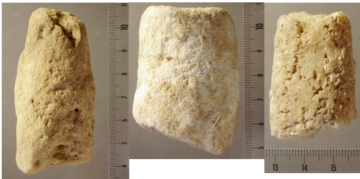
Fig. 8.– Ist 04 C 4 Ia Y1 37 n° 221, Ist 05 C 4 IIIc Y1 37/38 et Ist 03 C 4 IIIc Y1 37 n° 671

Ce troisième petit fragment marqué Ist 03 a été trouvé lors des fouilles de 2003 mais ne figurait pas dans les séries 2003 déjà étudiées. Il est long de 48,2 mm, a un diamètre variant de 27 à 29 mm et pèse 68 g (fig. 8 droite). Il ne porte aucune trace d'usage. Une petite trace de colorant rouge est peut-être d'origine naturelle, à moins qu'elle n'ait été acquise par contact.