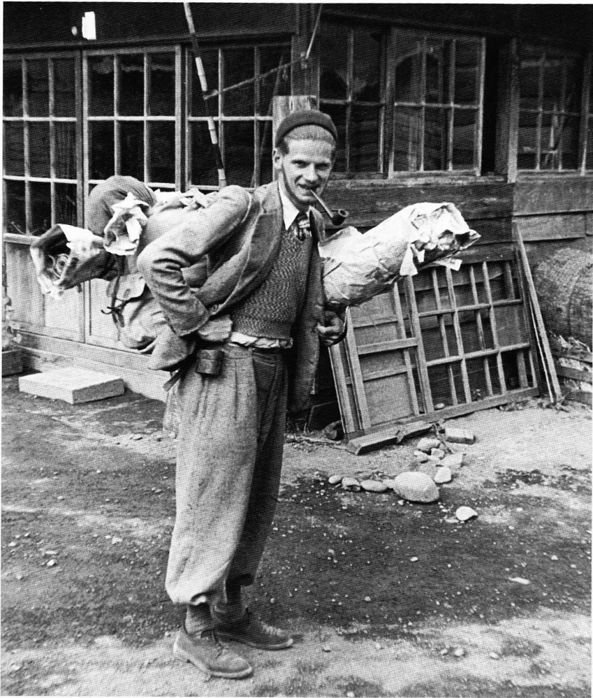
André Leroi-Gourhan au Japon entre 1937 et 1939

P aléontologue pour les uns, ethnologue, préhistorien, anthropologue des techniques pour les autres, André Leroi-Gourhan est pourtant un autodidacte qui a quitté l'école à 14 ans.