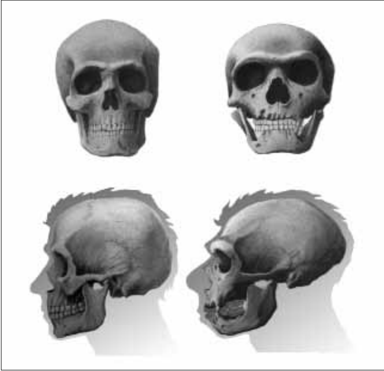
Fig. 3 – Comparaison du crâne et de la mandibule d'un homme moderne (à gauche) et d'un Néandertalien (à droite) (dessin Gilles Tosello).

évolué de leur côté vers les Néandertaliens, dont l'espèce s'est fixée aux alentours de 80 000 ans. L'isolement a pu influencer sur l'évolution morphologique en induisant des effets de dérive génétique, en particulier dans les petits groupes. De plus, les caractères acquis par l'adaptation à un milieu physique particulier se sont trouvés maintenus à cause de la réduction des échanges entre populations voisines. Il n'est donc guère étonnant qu'au terme d'un processus évolutif de plusieurs centaines de milliers d'années, les Néandertaliens se soient séparés des autres descendants des Homo erectus africains au point de constituer une espèce distincte.