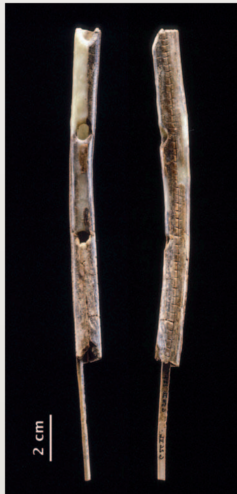
Flûte en ivoire de mammoth de la grotte de Geissenklösterle (Allemagne). Datée de 35 000 ans, c'est le plus ancien instrument de musique connu.