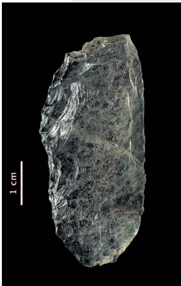
Racloir moustérien en cristal de roche provenant de Champ Grand (Roanne, Loire).

Le Moustérien débute en Europe il y a quelque 150 000 ans et s'achève vers 32 000 en France et 27 000 ans BP en Espagne. Le terme forgé par Gabriel de Mortillet en 1869 désigne un ensemble d'outils composé surtout de pointes sur éclat et de racloirs. Il est subdivisé en plusieurs faciès selon la proportion des outils, la présence de bifaces et l'usage du débitage Levallois 3 . On n'y connaît pas d'objets façonnés en matière dure animale même s'il peut arriver que l'extrémité pointue d'une esquille osseuse soit sommairement aménagée par raclage ; les outils sur grand éclat ou lame sont obtenus à partir du débitage discoïde 4 , du débitage Levallois et plus rarement d'un débitage laminaire au percuteur en pierre dure. Ce sont des racloirs, encoches, couteaux à dos et denticulés. Enfin, le façonnage 5 bifacial hérité du Paléolithique inférieur permet de réaliser des pièces bifaciales de tailles variées. Il est globalement difficile de distinguer les armes des outils « domestiques », certaines « pointes » moustériennes ayant plutôt servi de racloirs, d'autres d'éléments d'armes d'hast. ■