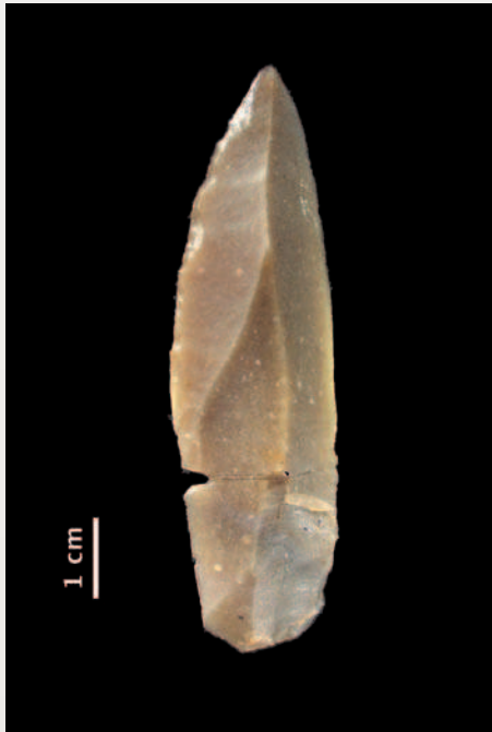
Pointe de Châtelperron, Canaule II, fouilles J. Guichard.

Le Châtelperronien (40-32 000 ans) s'étend de la côte cantabrique espagnole à la Bourgogne. S'il est globalement antérieur à l'Aurignacien du Sud-Ouest qui débute vers 37 000 ans, il pourrait être précédé par l'Aurignacien archaïque en Espagne et en Europe centrale ou du moins en être contemporain. Il associe des éléments de survivance – pointes, racloirs, encoches et denticulés; débitage de lames larges à la pierre tendre; poinçons sur esquilles appointés par raclage – et des éléments modernes : grattoirs, burins et perceurs sur lame; meules et broyeurs; pointes et poinçons entièrement façonnés. Grattoirs minces à front large, burins sur cassure ou sur tronçature et pointes à dos abattu appelées couteaux de Châtelperron sont caractéristiques. La spécialisation entre armes et outils est plus marquée que dans le Moustérien et les techniques de chasse se modi-