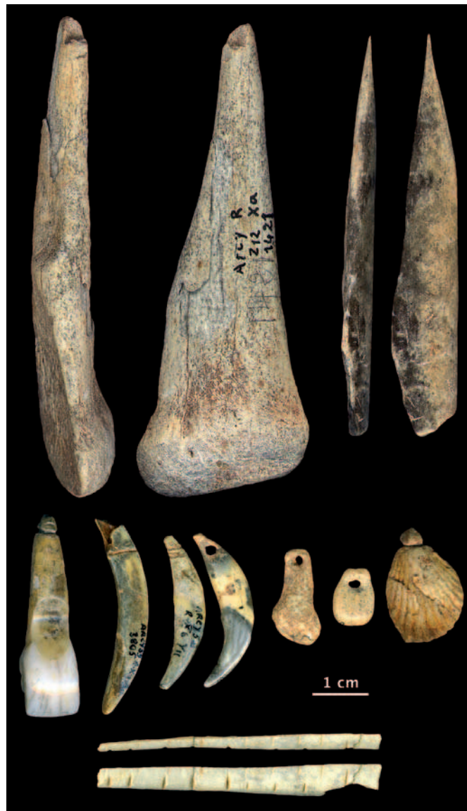
Outils en matière dure animale et éléments de parure du Châtelperronien de la grotte du Renne, Arcy-sur-Cure (Yonne).

Les historiens soulignent la relation entre la capacité d'invention et les pratiques de l'échange, de l'appropriation et de l'utilisation des techniques. L'effet de rencontre (d'idées mais aussi de personnes) est donc essentiel. Les rencontres peuvent se produire, ou pas, et certaines circonstances les favoriser, ou pas. L'une de ces circonstances est la densité croissante de la population, qui va rendre plus probable les rencontres d'idées et de gens par l'accroissement