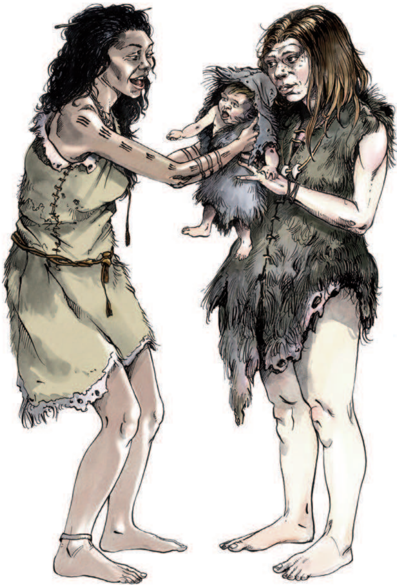
Mesdames sapiens (à gauche) et neanderthalensis (à droite) en pleine discussion. Dessin O.-M. Nadel.

Entre 40 000 et 30 000 ans, l'Europe de l'Ouest est le théâtre de deux événements majeurs : l'homme de Néandertal disparaît tandis que des innovations techniques attribuées à l'Homme moderne font leur apparition. Le lien entre ces événements a donné lieu depuis plus d'un siècle à des controverses sans fin.