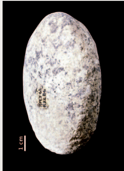
Meule (ci-dessous) et broyeur (ci-dessus) en granite châtelperroniens découverts dans la grotte du Renne à Arcy-sur-Cure.

fient avec l'usage de projectiles plutôt que d'armes d'hast. À la grotte du Renne à Arcy-sur-Cure (Yonne), il est exceptionnel avec de longues épingles, des sagaies, pointes et poinçons obtenus par rainurage dont certains gravés de décors géométriques et des tubes en os d'oiseau sciés. Des dents y ont été perforées et rainurées comme à la Grande-Roche à Quinçay (Vienne). ■