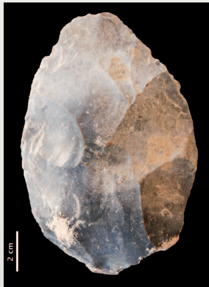
Biface cordiforme moustérien en silex sénonien gris provenant de Coursac (Dordogne).