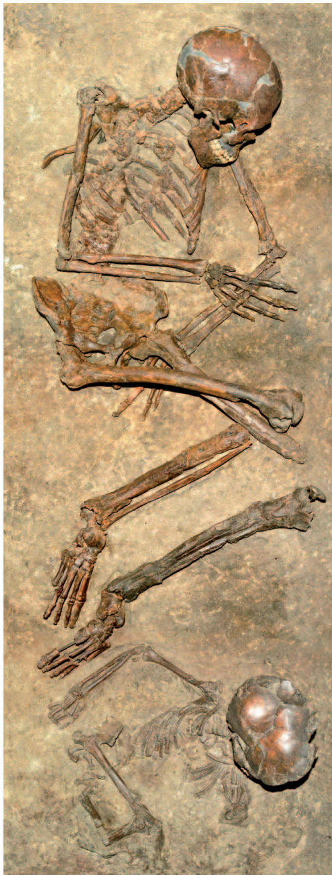
Jeune femme enterrée dans une fosse avec un enfant d'environ six ans recroquevillé à ses pieds. Grotte de Qafzeh, Galilée (Israël). 92 000 ans.

Dès le XIX e siècle, les préhistoriens ont pris l'habitude d'attribuer des noms aux différents assemblages laissés par les hommes préhistoriques : ils ont parlé d'industrie « moustérienne », « aurignacienne », « châtelperronienne », etc., en fonction des outils et des types de débitage 2 observés. Nous utiliserons ces labels pour des raisons de commodité,