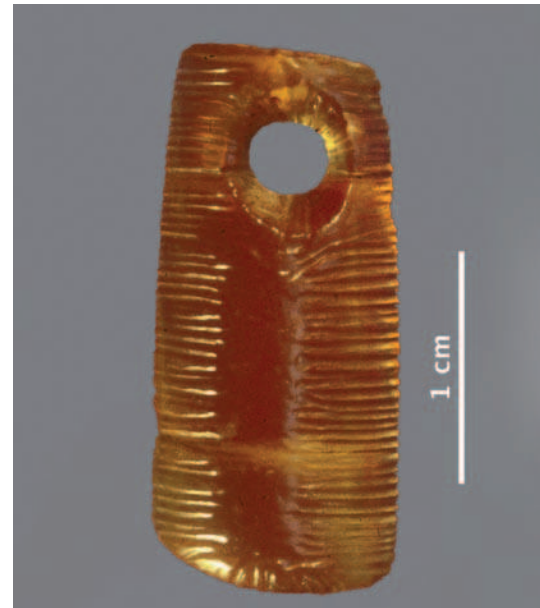
Perle translucide découpée dans un fossile de bélemnite trouvée à Kostienki 17 (Russie). C'est une des plus anciennes perles connues, de plus de 36 000 ans.

Deux techniques principales permettent de perforer une dent pour en faire une perle : soit on la perce par pression ou percussion indirecte après un éventuel amincissement de la surface, soit on opère directement par rotation bidirectionnelle. La première technique, qui donne un résultat moins régulier, est connue au Châtelperronien et persiste à l'Aurignacien où elle est toutefois minoritaire. En revanche, la technique par rotation n'est attestée qu'à l'Aurignacien et se développera tout au long du Paléolithique supérieur. Or, les plus anciennes parures ont été trouvées en Europe centrale et sont attribuées à un Aurignacien antérieur de plusieurs millénaires au Châtelperronien d'Europe de l'Ouest. Citons 17 canines de renard et une perle en bélemnite perforées par rotation à Kostienki 17 (Russie)