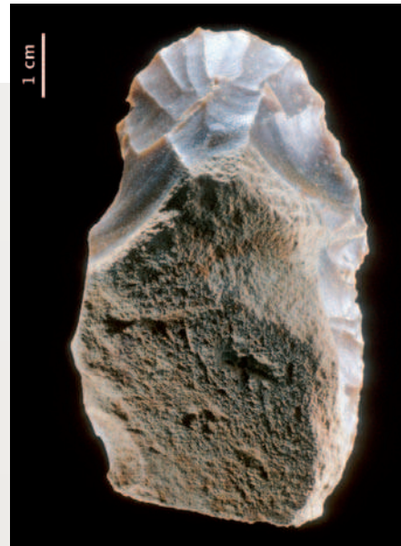
Nucléus à lamelles de type « grattoir caréné », Aurignacien ancien, Corbiac Vignoble II, fouilles J. Tixier.