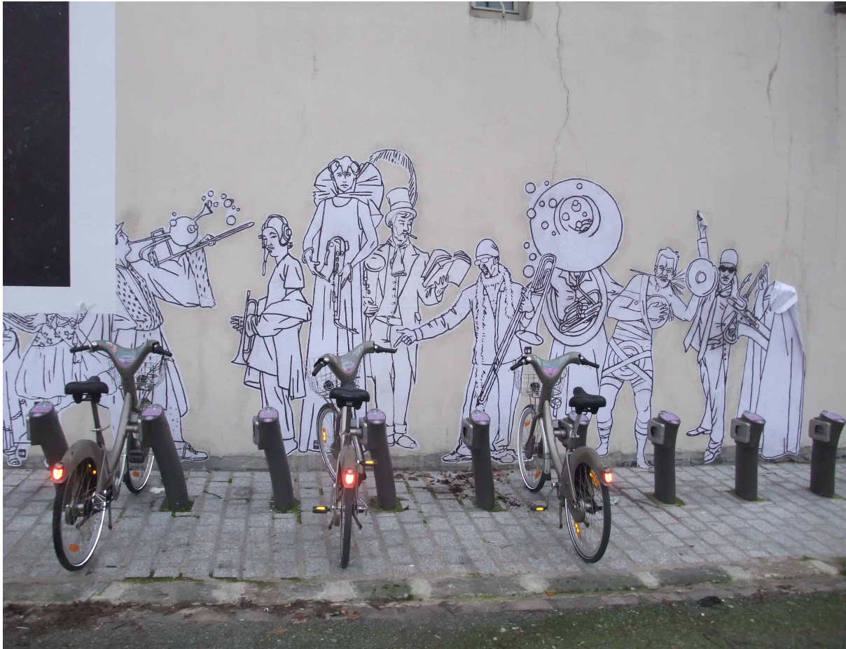
Figure 4 : Les formes incontrôlables de « ludification » de l'espace public

Loin d'être seulement programmées dans les espaces conçus par les autorités ou les entreprises, les dynamiques sociales continuent ainsi de contribuer à la production de l'espace public et de la ville.