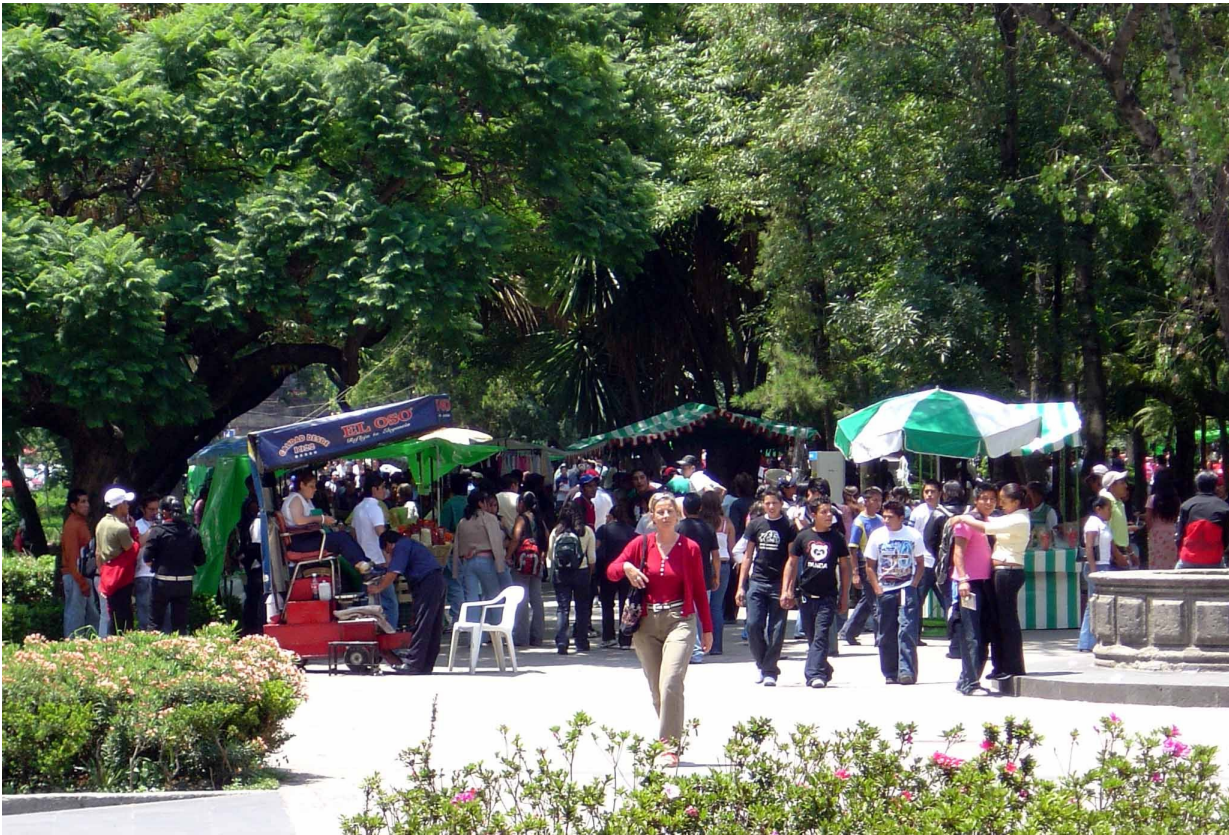
Figure 2 : L'espace public aménagé pour les loisirs (cliché J.Monnet, juin 2006).

Le jardin de la « Alameda central », dans le centre historique de Mexico, a été créé à la fin du 16ème siècle pour la récréation du public par l'administration du vice-royaume de la Nouvelle-Espagne. Depuis lors, il est resté un haut-lieu des loisirs dominicains, où se mêlent les classes populaires et les classes moyennes ainsi que les générations, et où la consommation festive accompagne la promenade en famille, les réunions d'amis, les rencontres amoureuses ou les activités sportives.