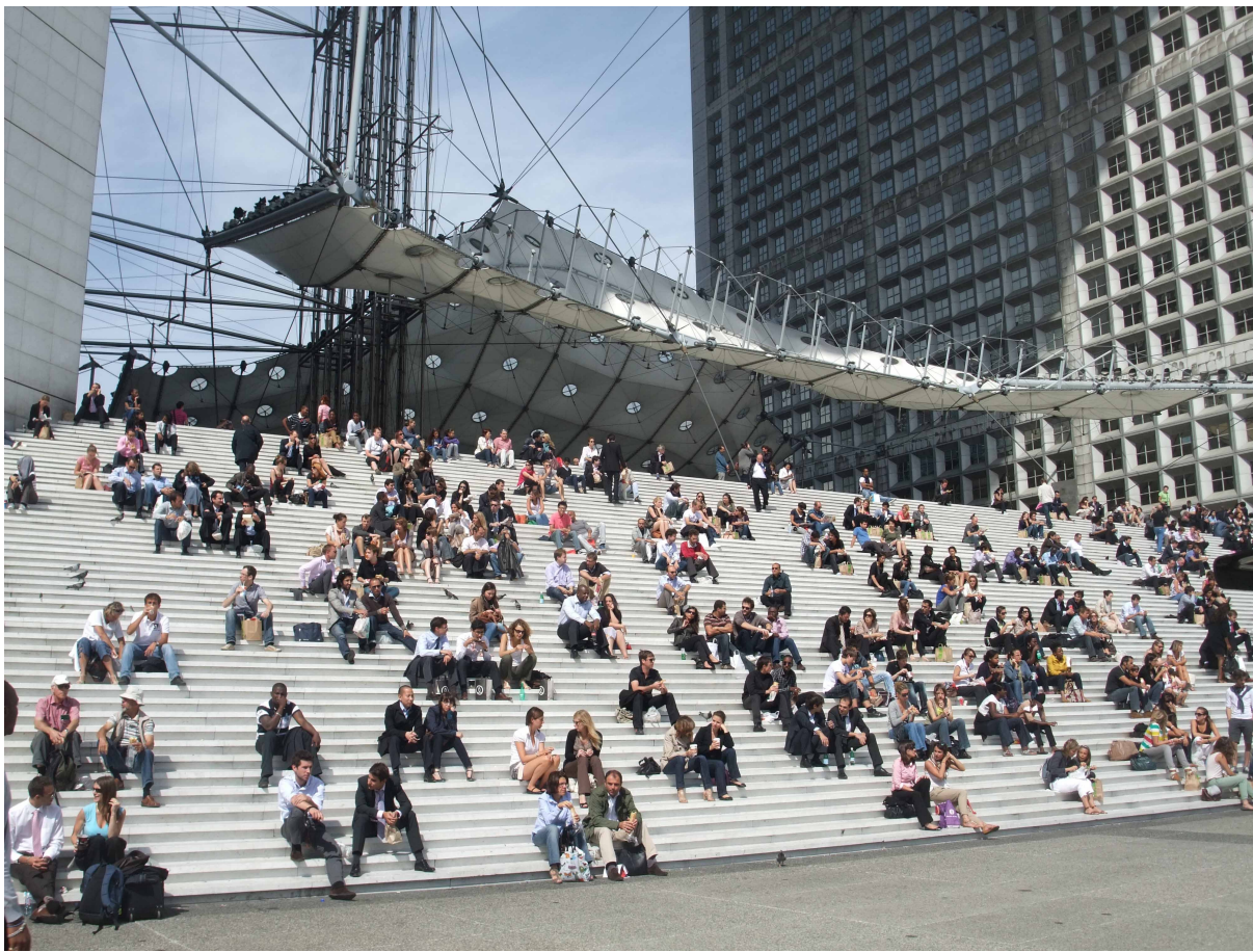
Figure 1 : L'espace public comme spectacle.

L'escalier monumental de la Grande Arche de La Défense domine l'esplanade centrale du centre des affaires. Dès que les conditions météorologiques le permettent, de nombreux employés, clients du centre commercial voisin et touristes utilisent les marches pour s'y asseoir, s'y reposer, discuter entre amis ou collègues, prendre un repas ou une collation sur le pouce, fumer une cigarette et admirer la vue guidée par l'alignement des tours de bureaux vers le centre de Paris et l'Arc de Triomphe. Bien que non aménagé pour les loisirs, cet espace public est massivement détourné de sa fonction de piédestal par les pratiques sociales.