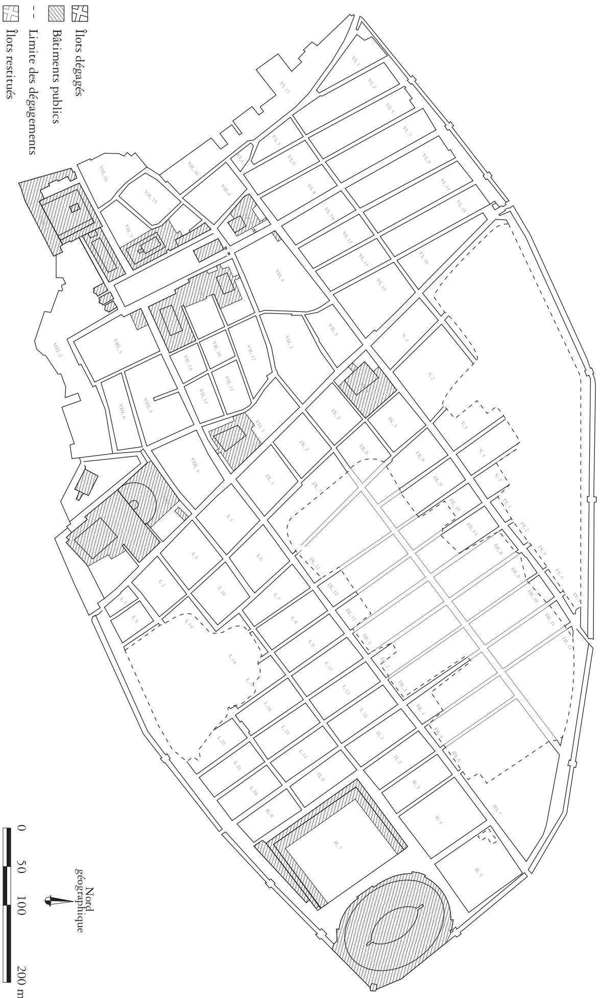
Fig. 2. Plan général de Pompéi [68]