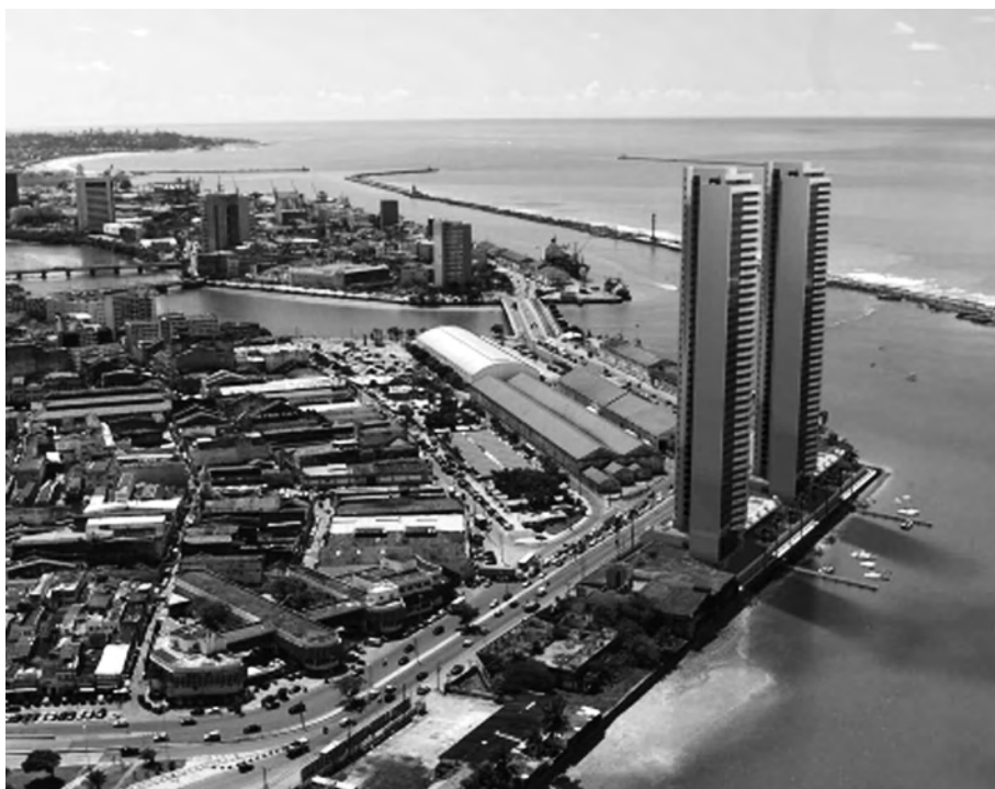
Figure 1 – Les deux tours de luxe au centre de Recife