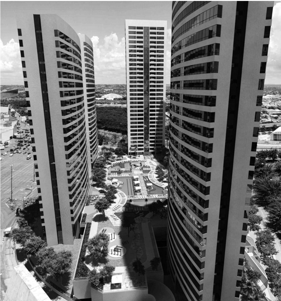
Figure 2 – Image publicitaire de l' Evolution Shopping Park

L'ensemble résidentiel est totalement clos et sécurisé avec un accès privilégié au Shopping Recife ce qui est un argument de vente important, au même titre que la proximité de deux supermarchés, d'une école privée de renom, de la plage et de l'aéroport. Le promoteur déclare réaliser un Home&Resort , s'insérant bien dans cette nouvelle tendance. Le triptyque parc de loisirs/centre commercial/habitat annonce une manière de fabriquer et d'habiter les villes contemporaines où « l'insularisation » des formes et des pratiques tendent à s'amplifier. La mise en scène des loisirs et des vacances toute l'année symbolise et promeut une nouvelle manière de vivre, une « vie au vert ».