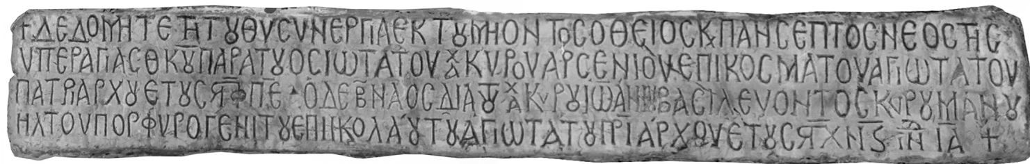
Fig. 3. Photographie de l'inscription de Varnakova