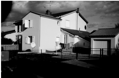
Les transformations de l'habitat : extensions (rajout de volume), embellissement du jardin (pelouses, terrasse...), nouveau traitement des clôtures, etc.