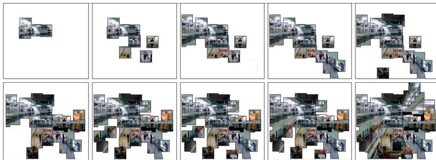
Figure 1. Vidéogrammes de la vidéo Santo Domingo n° 863

Ce qui se joue ici c'est le rapport entre la configuration spatiale du lieu et les actions sociales qui s'y déroulent. Le choix d'un point de vue panoramique permet de restituer l'ensemble de l'espace en question. Le fait de multiplier les moments de prise de vue permet d'interroger la récurrence de chacune des actions relevées en fonction de l'endroit où elles se réalisent. Le fait d'isoler par un système de cache chacune de ces actions permet alors de les identifier, de les classer et d'en dresser une typologie. Ces actions s'apparentent en réalité à ce que l'on appelle dans le domaine des ambiances urbaines et architecturales des figures , c'est-à-dire « la façon pour le lieu de s'incarner dans un personnage » (Amphoux, 2001 : 163). Dans la vidéo présentée ici nous pouvons retrouver une série de figures de parcours identifiées par Jean-Paul Thibaud dans sa recherche sur la place de la Convention à Paris : celle du pivot du trajet , du territoire de l'attente , du pause en pause ou de la curiosité en passant (Thibaud, 2007 : 210). Ce procédé offre alors deux avantages : d'abord de renforcer le caractère immuable de l'architecture, un mur reste un mur quel que soit le moment de la journée ou de la semaine, ensuite de révéler les différents types de figures que cette architecture peut engendrer, en interrogeant leur récurrence et leur régularité à différents