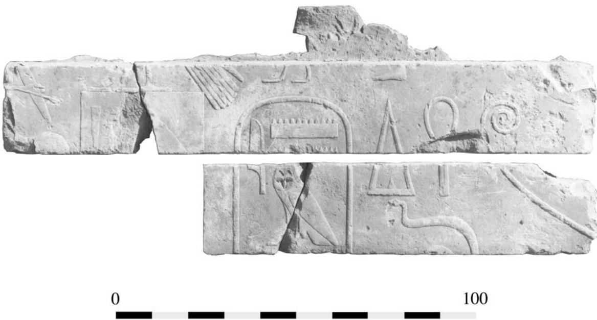
Fig. 1 : Assemblage de blocs d'Amenemhat I er dans les magasins du temple de Louxor