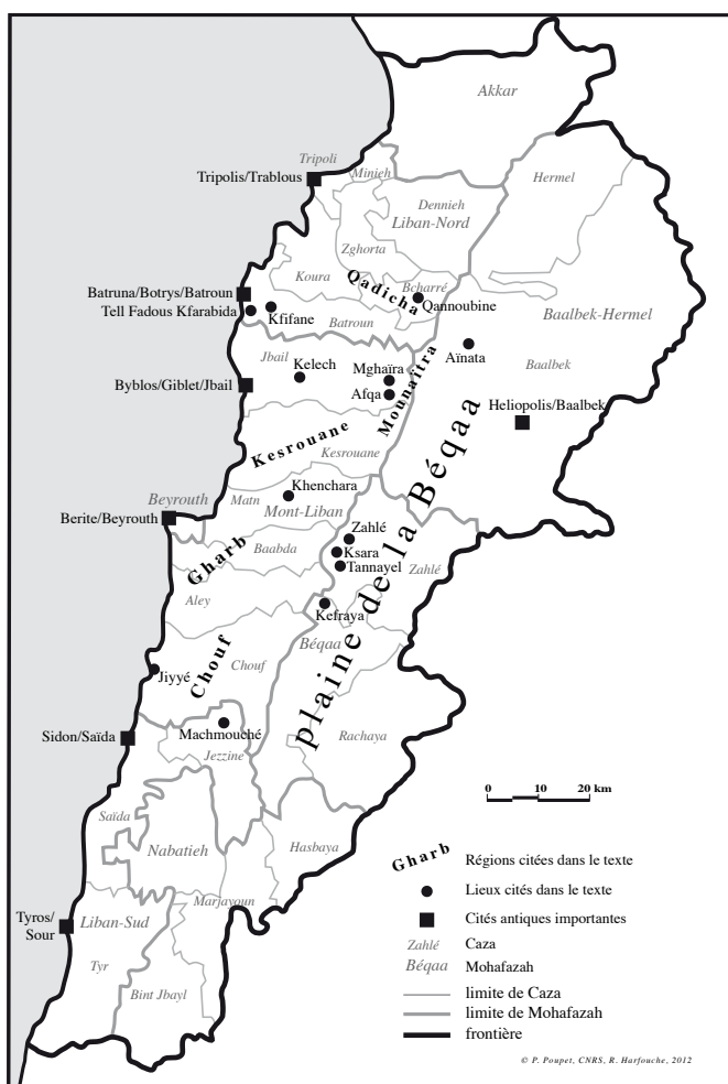
Carte 2. Carte du Liban avec les limites des circonscriptions administratives et les principaux lieux de la viticulture nommés dans le texte

Les grands vignobles libanais actuels se trouvent sur les coteaux de la Béquaa entre 900 et 1 400 m d'altitude.