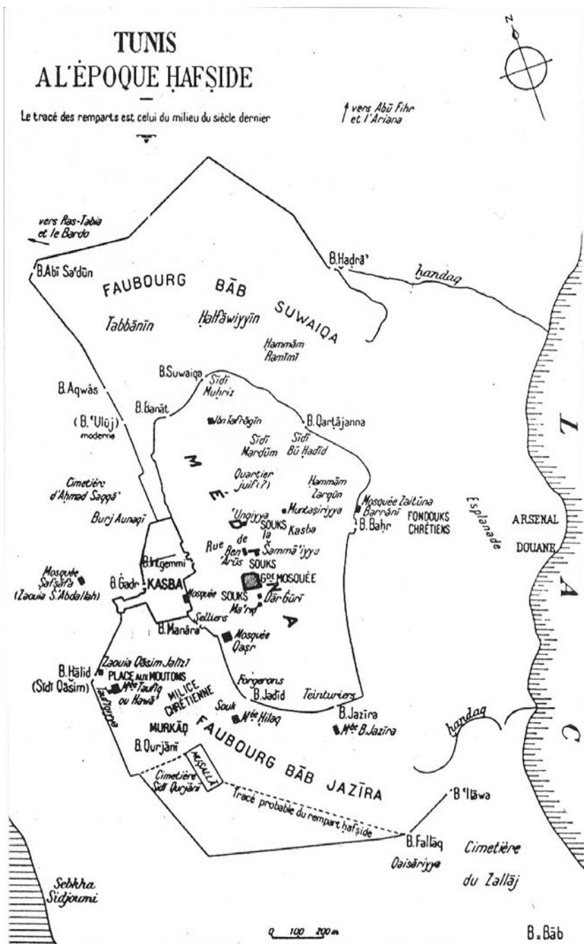
Plan de Ceuta musulmane d'après M. Chérif, Ceuta aux époques almohade et mérinide , Paris, 1996 : 218.