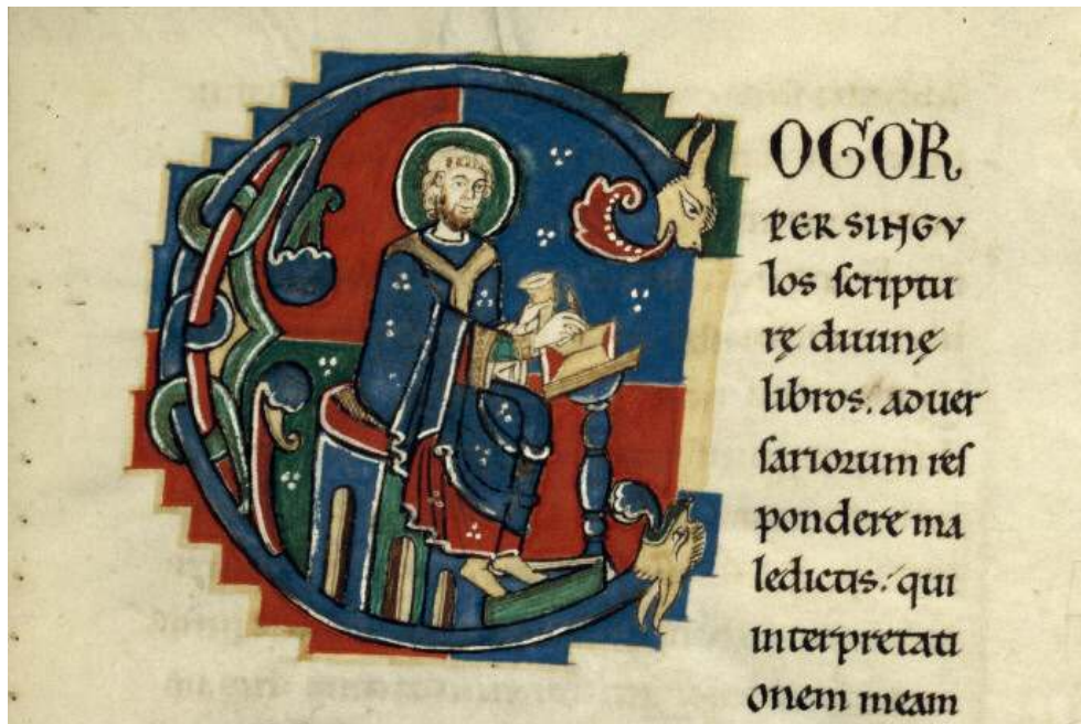
Fig. 3 – Bible de Saint-Bénigne de Dijon , op. cit., fol. 235r°, initiale C.