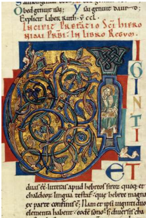
Fig. 2 – Bible de Saint-Bénigne de Dijon , op. cit., fol. 100r°, initiale U.