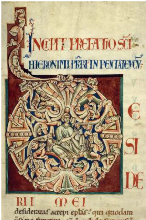
Fig. 1 – Bible de Saint-Bénigne de Dijon , DIJON, Bibliothèque municipale , ms. 2, fol. 6r°, initiale D, 2 e quart du XII e siècle ?.