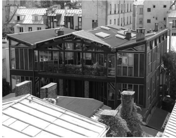
Fig. 4 – Le Lavoir du Buisson-Saint-Louis, 10 e

ménages ayant repris un ancien lavoir industriel pour en faire leurs logements au début des années 1980 (cf. fig. 4). Le 26 rue du Buisson-Saint-Louis est une ancienne imprimerie rachetée par un marchand de biens, transformée en logements répartis autour d'un espace ouvert ayant conservé la structure métallique de l'usine, et revendue par lots en 2000. Enfin, la cour de Bretagne, qui date de la fin du XVIII e