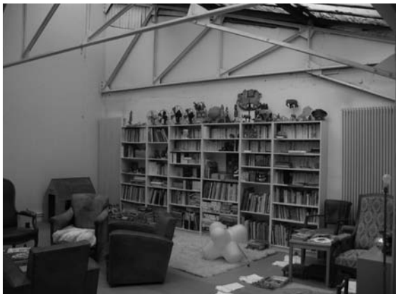
Fig. 6 – Un appartement de « gentrificateurs » dans une cour réhabilitée

Selon le mode de réhabilitation de la cour, on peut distinguer plusieurs types de « gentrificateurs ». Dans les cours qui se « gentrifient » spontanément, les « gentrificateurs » sont souvent des artistes ou des professions culturelles au