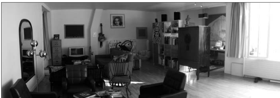
Fig. 5 – Un appartement de « gentrificateurs » dans une cour réhabilitée

À part quelques logements de facture classique, la plupart des appartements de ces cours se caractérisent par une surface élevée, autour de 100-150 m 2 , et de beaux volumes avec des hauteurs sous plafond atteignant parfois 4 mètres. Dès les années 1980, ces appartements sont aménagés autour d'un vaste espace ouvert faisant office de salle à manger, salon et cuisine, s'inspirant du style des lofts , tout en ménageant des chambres, souvent petites.