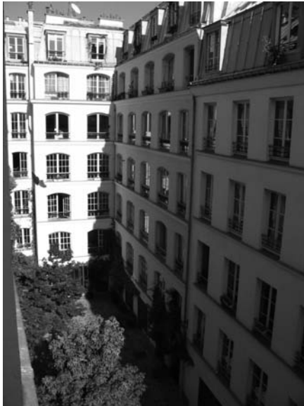
Fig. 2 – La cour des Shadocks, 71 rue du Faubourg Saint-Antoine, 11 e

Deux de ces cours sont situées dans le faubourg Saint-Antoine, il s'agit de la cour de l'Étoile d'Or, au 75 rue du Faubourg-Saint-Antoine (11 e arrondissement), et de la cour voisine, au numéro 71. La première date donc du XVII e siècle et fut remaniée au cours du temps, mise en copropriété dès les années 1950 et « gentrifiée » peu à peu depuis les années 1980. La seconde fut construite au XIX e siècle avec des immeubles de six étages présentant une cohérence architecturale, puis rachetée en 1998 par un marchand de biens, rebaptisée cour des Shadocks 3 , réhabilitée et revendue par lots jusqu'en 2000 (cf. fig. 2).