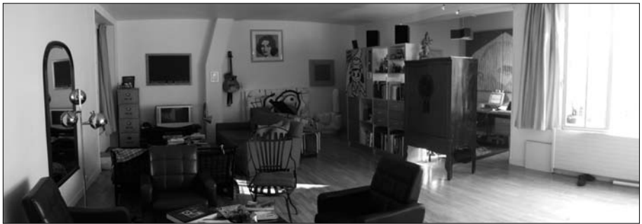
Fig. 5 – Un appartement de « gentrificateurs » dans une cour réhabilitée

À part quelques logements de facture classique, la plupart des appartements de ces cours se caractérisent par une surface élevée, autour de 100-150 m 2 , et de beaux volumes avec des hauteurs sous plafond atteignant parfois 4 mètres. Dès les années 1980, ces appartements sont aménagés autour d'un vaste espace ouvert faisant office de salle à manger, salon et cuisine, s'inspirant du style des lofts , tout en ménageant des chambres, souvent petites.