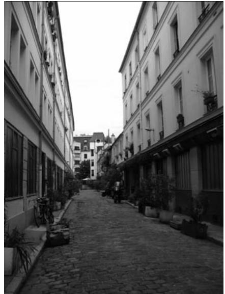
Fig. 3 – Le passage de la Fonderie, 11 e