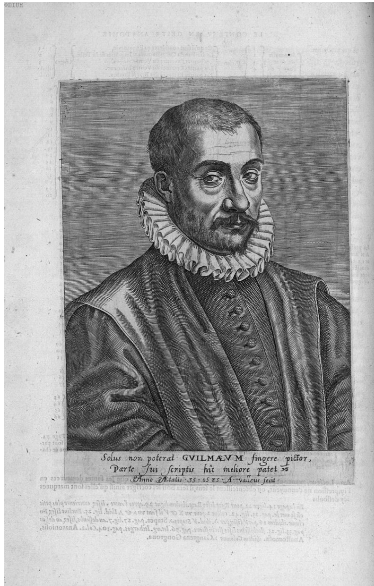
[Portrait de Jacques Guillemeau (1549-1613) : Tables anatomiques avec les pourtraicts et declaration d'iceulx [...], p. 52]