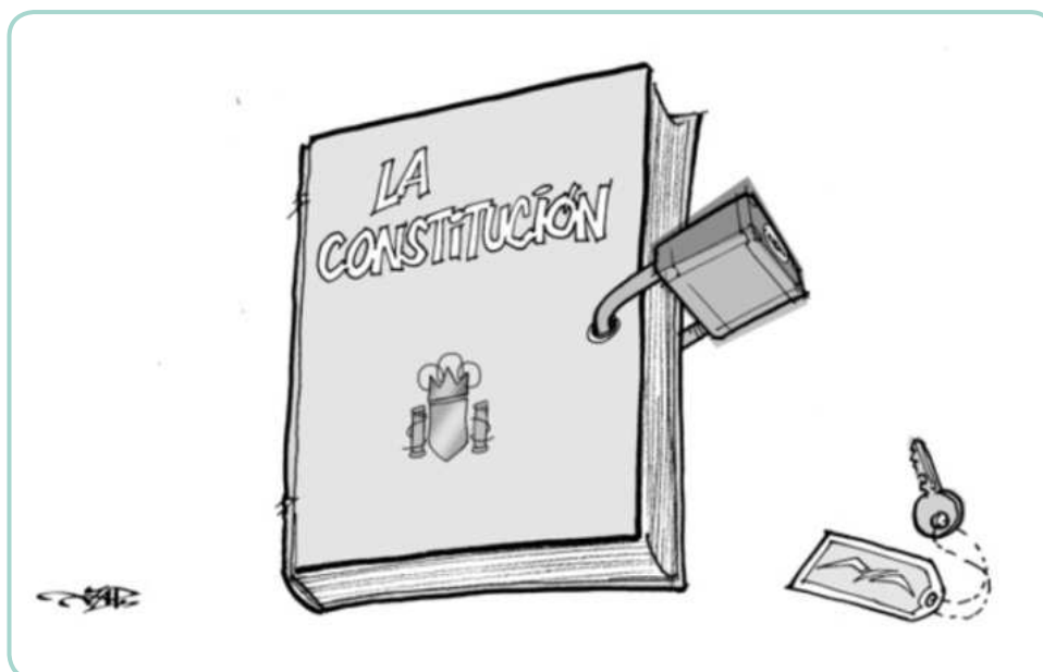
Imatge 4. La punta d'en Jap. El Punt Avui. 23 de setembre de 2012.