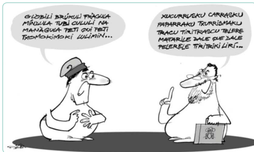
Imatge 3. La punta d’en Jap. El Punt Avui. 21 de setembre de 2012. Acudit que descriu una conversa entre Artur Mas i Mariano Rajoy, presidents de la Generalitat de Catalunya i del govern espanyol, respectivament.

Comunicar és obrir un procés de transformació de les representacions socials. En la mesura que les representacions socials s’estenen a capes socials més àmplies es barregen amb altres representacions i, en conseqüència, les seves característiques es modifiquen. Com més circulen, més es transformen en representacions de representacions.