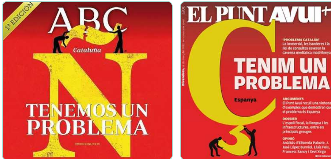
Imatge 1. Portada del diari ABC i, en resposta, del diari El Punt Avui (Imatge 2.) on s'identifica l'altre com a objecte conflictiu.

La sociologia és una ciència que té com a objectiu comprendre interpretant l'activitat social. De la classificació de l'acció humana que fa Weber en la seva sociologia comprensiva, utilitzem l'acció afectiva i l'acció racional com a conceptes i n'analitzem l'equilibri en la realitat social catalana. A més, és evident que la teoria de la dominació política ens ajuda a situar la relació entre Catalunya i Espanya. En aquest sentit, Hirschman ens dirigeix cap al comportament dels actors, les seves estratègies i els conflictes entre forces socials.