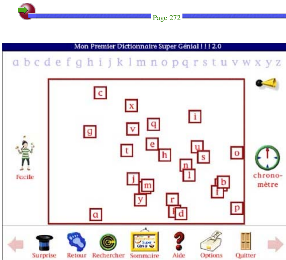
Figure 3 : écran du jeu "Alphabet".

Dans "Alphabet", le système demande à l'apprenant de cliquer sur chacune des lettres de l'alphabet : "Clique sur les 26 lettres de l'alphabet avant que le temps ne s'écoule". Toutes les lettres se déplacent simultanément dans le rectangle rouge et chaque fois que l'apprenant clique sur une lettre, l'ordinateur donne le nom de la lettre.