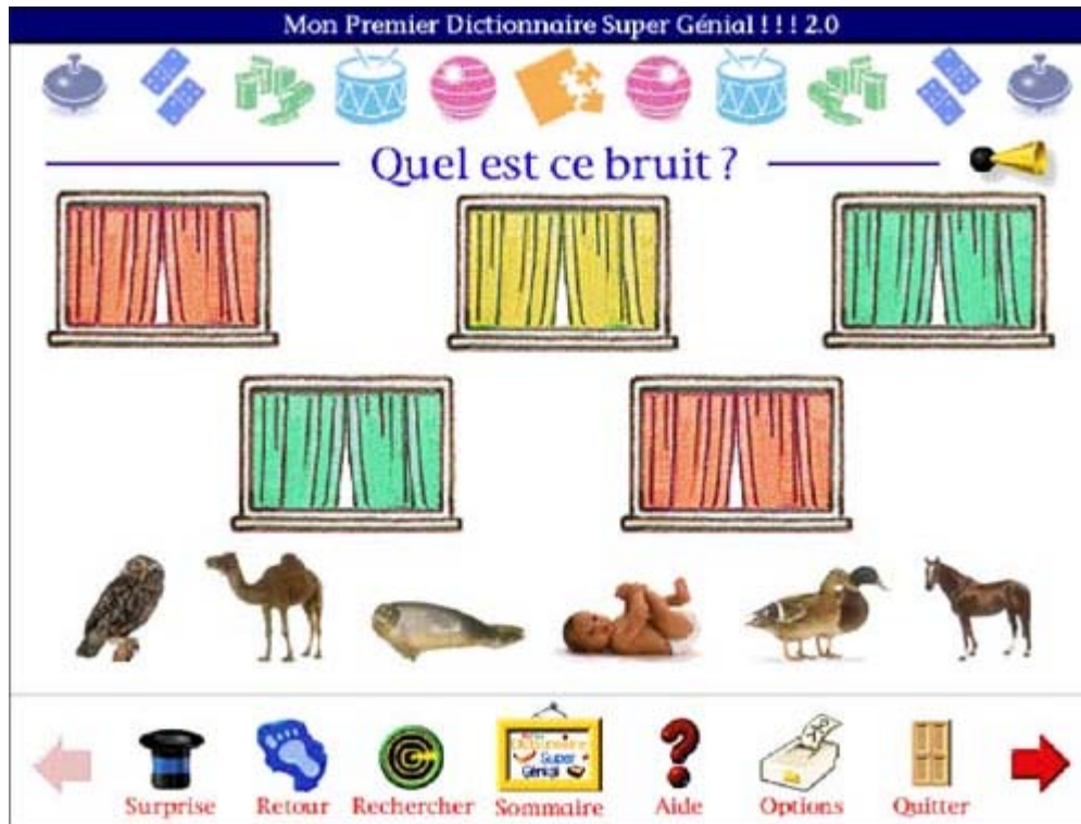
Figure 5 : écran du jeu "Quel est ce bruit ?".

Il s'agit ici d'une tâche de discrimination et d'association. L'apprenant doit différencier les cris ou les sons qu'il entend et retrouver ensuite l'objet, la personne ou encore l'animal qui lui correspond. Dans le cadre de l'apprentissage initial de la lecture, les enfants doivent être capables de différencier les sons qu'ils entendent dans les mots à l'oral et de les associer à un ou plusieurs graphèmes (Cléder & Chambreuil, 2001). Des résultats d'expérimentation ont montré que les enfants qui parviennent à discriminer auditivement avant l'apprentissage de la lecture, ont des facilités à discriminer ensuite les sons qui composent les mots. Ce jeu semble donc faciliter, au tout début, l'apprentissage de la lecture.