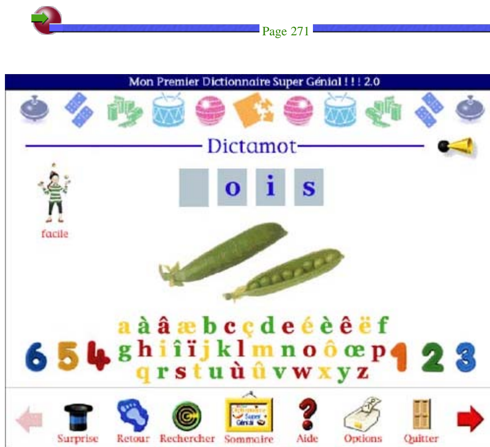
Figure 2 : écran du jeu "Dictamot".

Le premier jeu, "Dictamot" consiste pour l'utilisateur à cliquer à l'aide de la souris sur une ou plusieurs lettres ou graphèmes présents à l'écran pour compléter un mot. Ce mot est partiellement écrit à l'écran, il est donné à l'oral par le système et une illustration l'accompagne. Dans l'exemple présenté ci-dessous, le système informatique demande à l'apprenant de sélectionner la lettre qui manque pour écrire le mot [pwa].