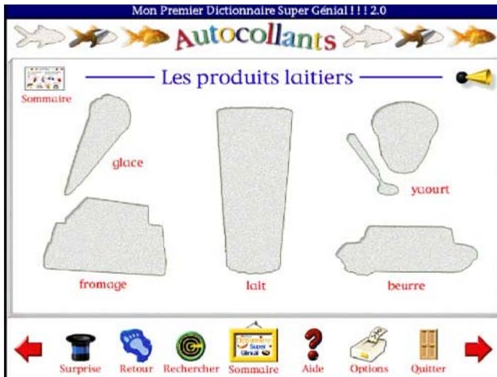
Figure 7 : écran de l'activité "Les autocollants".

rechercher des mots ayant pour caractéristique d'appartenir à un même thème, une même catégorie sémantique comme les animaux, les transports ou encore les aliments. Aucun commentaire ni consigne ne présente explicitement l'activité à l'apprenant. Les concepteurs ont certainement fait l'hypothèse que cette activité ne nécessitait pas de consigne particulière dans le sens où l'apprenant collectionne déjà généralement des timbres, différentes boîtes ou encore des autocollants qu'il colle sur des plaquettes support. Par conséquent, on peut supposer que les apprenants connaissent l'objectif de cette activité.