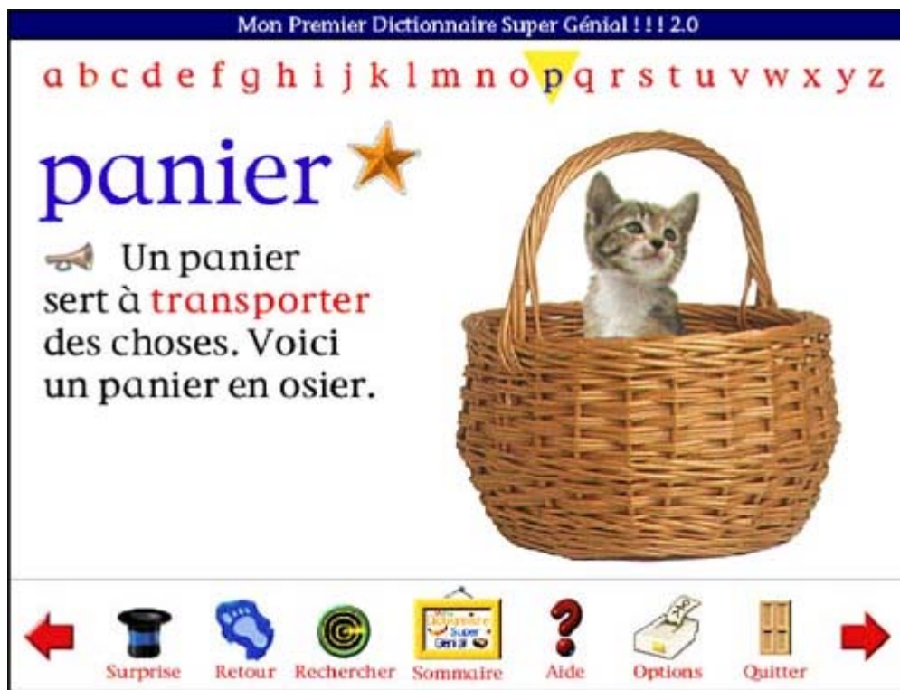
Figure 9 : écran du mot "panier" du dictionnaire.

Nous pouvons, cependant, déterminer plus précisément les différents types d'informations qui sont présentées à l'écran pour chaque mot : des informations liées à la forme écrite du mot, des informations sur le lien entre le système de l'écrit et le système de l'oral et des informations d'ordre sémantique.