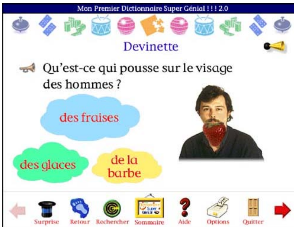
Figure 4 : écran du jeu "Devinette" après réponse de l'apprenant.

Lorsque l'apprenant clique sur une des réponses, l'image correspondante apparaît à l'écran sur la partie droite. Dans l'exemple présenté dans la figure 4, l'apprenant a cliqué sur la réponse "les fraises".