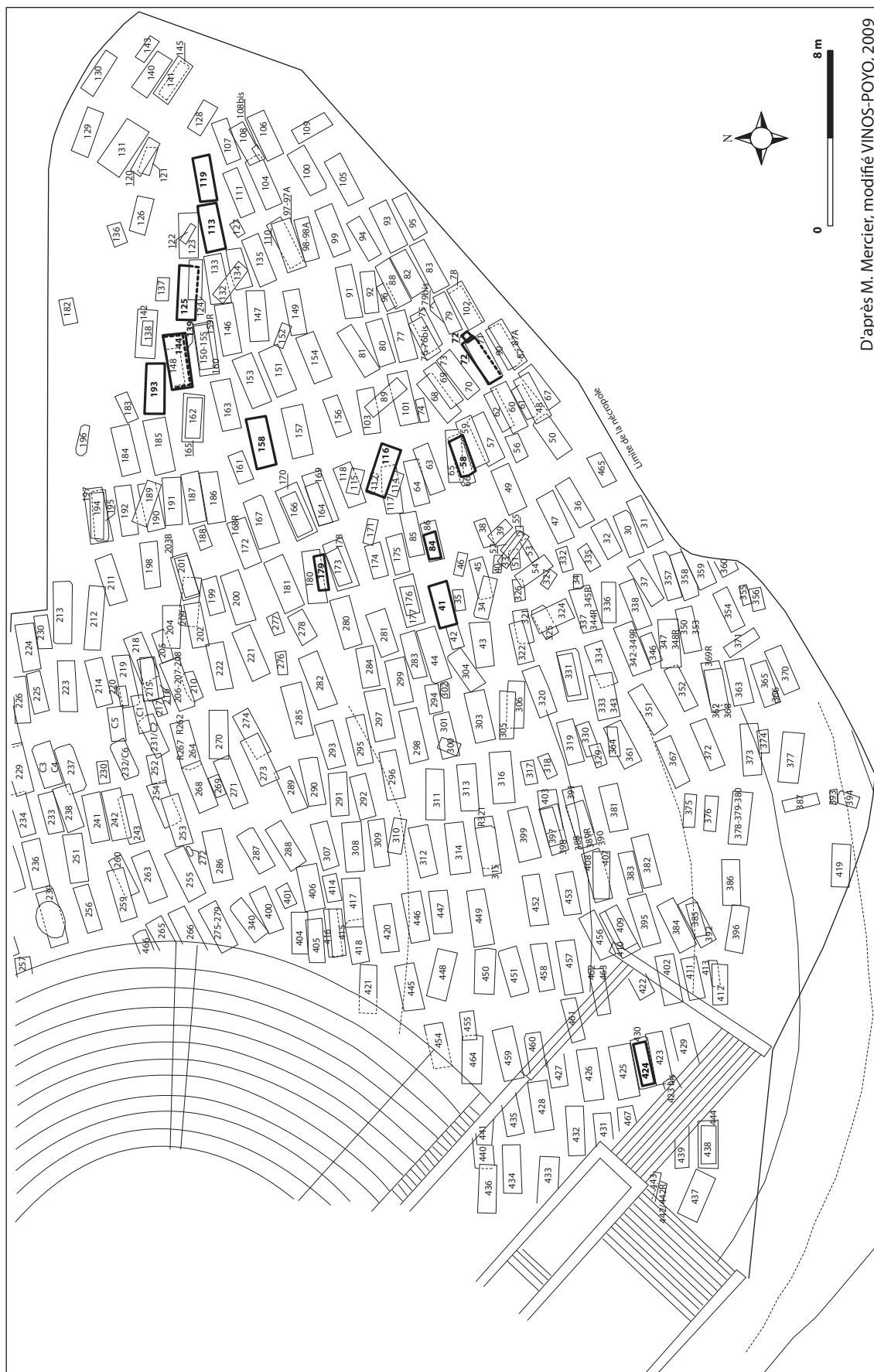
D'après M. Mercier, modifié VINOS-POYO, 2009