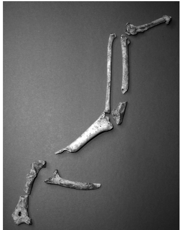
Fig. 5. Restes osseux du tétras-lyre de la tombe 58.

découpe enveloppent cette perforation. Nous avons tout d'abord supposé l'abattage de l'individu, cependant, au vu de la régularité du travail ainsi que de sa précision, cette opération n'a pu être réalisée qu'après la mort de l'animal. Une seconde ouverture semblable à celle décrite précédemment a été observée au niveau basilaire de l'os occipital. Ces deux cavités coïncidant verticalement, ce crâne a fait l'objet d'une préparation minutieuse, mais à quelles fins ? La consommation de la cervelle de l'animal ne nécessite pas, a priori , de perforer le crâne en deux endroits. L'introduction d'une pièce (un bâton, une barre ou plus vraisemblablement un pieu) traversant le crâne de part en part semble plus envisageable. L'interprétation reste délicate car cet acte relève sans doute d'un rituel précis dont l'essentiel reste inconnu même s'il peut également correspondre à un marquage de la tombe. Ce