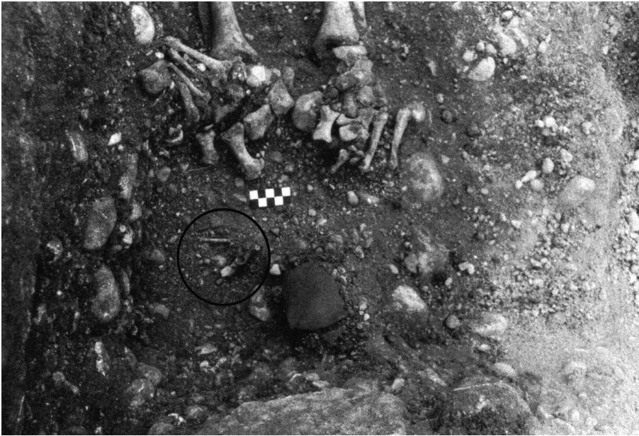
Fig. 3. Tombe 144. Restes de lièvres près des pieds.

équien lors du remplissage de la sépulture peut revêtir plusieurs interprétations : symbole du pouvoir de l'individu, matérialisation de son rôle terrestre (si l'individu était un cavalier par exemple) ou encore rôle psychopompe de l'animal. L'altération de ce vestige dénote cependant une assez longue exposition à l'air ne nous permettant sans doute pas de confirmer les hypothèses précédentes. Au cours de la période mérovingienne, les équivalents sont inexistantes mais certains exemples antérieurs témoignent de pratiques comparables. Ainsi, au cours du Haut-Empire à Valladas (BEL, 2002), les équidés, à l'inverse des autres animaux, sont essentiellement représentés (symbolisés?) dans les tombes par des pièces non bouchères isolées 2 , ce que l'on peut rapprocher du cas de Crotenay.