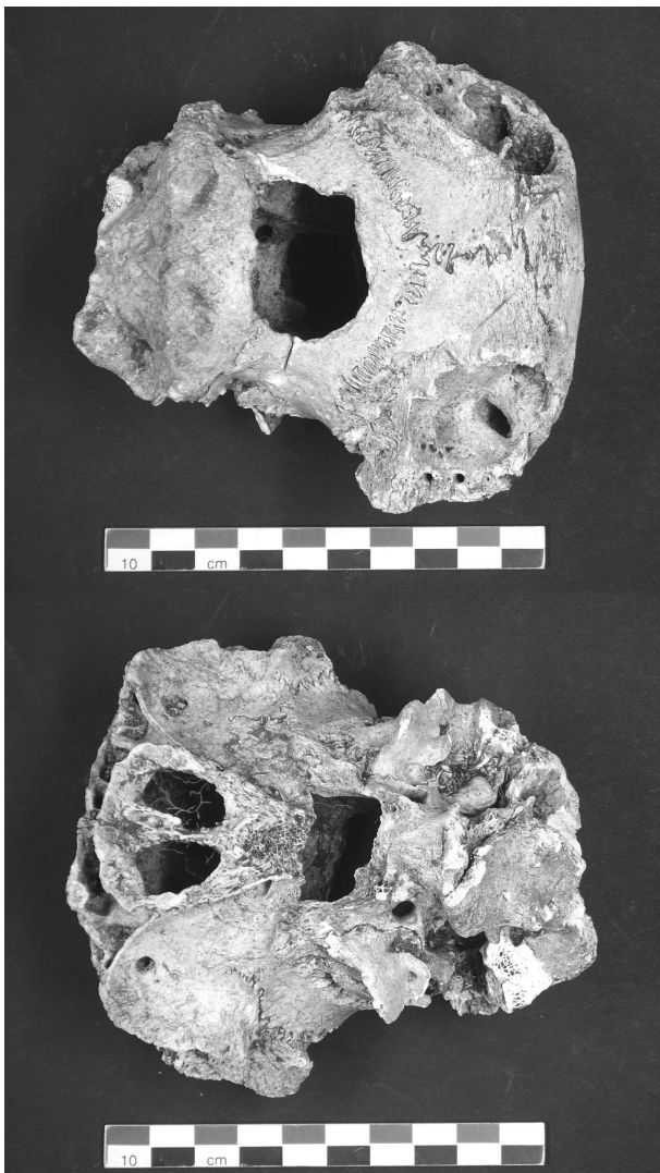
Fig. 4. Neurocrâne de mouton perforé de la tombe 125 (vue frontale et ventrale).

découpe enveloppent cette perforation. Nous avons tout d'abord supposé l'abattage de l'individu, cependant, au vu de la régularité du travail ainsi que de sa précision, cette opération n'a pu être réalisée qu'après la mort de l'animal. Une seconde ouverture semblable à celle décrite précédemment a été observée au niveau basilaire de l'os occipital. Ces deux cavités coïncidant verticalement, ce crâne a fait l'objet d'une préparation minutieuse, mais à quelles fins ? La consommation de la cervelle de l'animal ne nécessite pas, a priori , de perforer le crâne en deux endroits. L'introduction d'une pièce (un bâton, une barre ou plus vraisemblablement un pieu) traversant le crâne de part en part semble plus envisageable. L'interprétation reste délicate car cet acte relève sans doute d'un rituel précis dont l'essentiel reste inconnu même s'il peut également correspondre à un marquage de la tombe. Ce