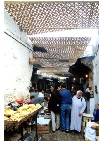
Fig. 6 Le corps à corps du souk : corps physiques et corps humains

Le toucher occupe ici une place stratégique et s'exprime dans un ensemble de gestes qui mettent en contact les corps (Fig. 6). Il résulte cependant d'une autre conception de l'enveloppe charnelle qui permet de dissocier la tactilité de la sensualité. A ce sujet, Edward T. Hall a formulé des observations fort perspicaces concernant la conception qu'ont les Arabes de la "zone privée" : "Dans le monde occidental, on définit la personne comme un individu à l'intérieur d'une peau et même les vêtements sont en général considérés comme inviolables. Pour pouvoir les toucher, l'étranger devra en demander la permission. Cette règle est valable en certaines régions de France où le simple fait de toucher une personne au cours d'une discussion était autrefois légalement considéré comme une attaque. Chez l'Arabe, la localisation de la personne par rapport au corps est très différente. La personne existe quelque part au fond du corps. Mais le moi n'est pourtant pas complètement caché puisqu'une insulte peut l'atteindre très aisément. Il est à l'abri du contact corporel mais non pas des mots."