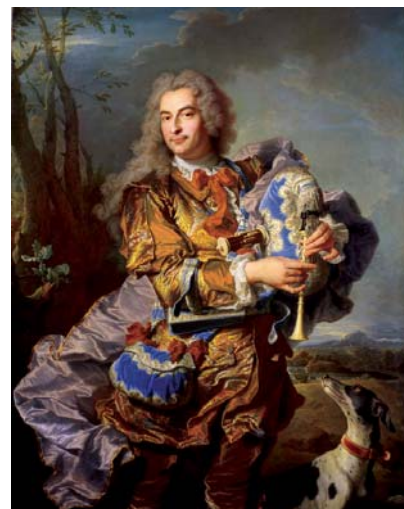
Fig. 7 : Le Repos de Diane par François Boucher (1742) et Gaspard de Gueidan par Hyacinthe Rigaud (1734)