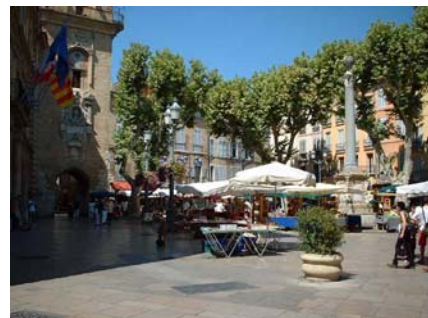
Fig. 4.1 Fontaine des Augustins