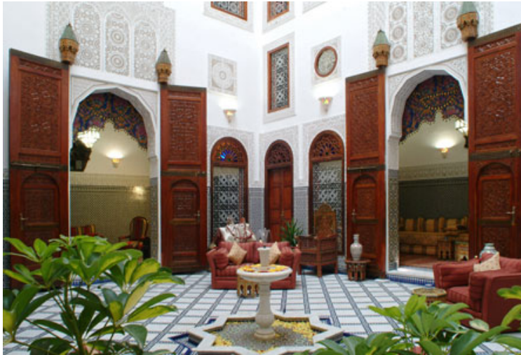
Fig. 2 Maison dans la Médina de Fez

Au delà s'étend un tissu urbain essentiellement résidentiel, principalement desservi par les derbs. Il s'agit plutôt d'impasses privatives, très étroites, sombres et bordées de hauts murs fermés, sur lesquels n'ouvrent que les portes des habitations. Ces portes ne sont pratiquement jamais en vis-à-vis. Derrière ces portes se trouvent les maisons, retournées sur la cour, qui présentent, à l'inverse des derbs, une grande régularité géométrique, une large ouverture sur les pièces intérieures et une somptueuse décoration, sur laquelle jouent les rayons d'une lumière généreuse (fig. 2). Au sommet de la maison, il y a les terrasses systématiquement accessibles de l'intérieur de la maison. Elles s'ouvrent sur un paysage en même temps très vaste et en même temps protégé des regards des maisons voisines.