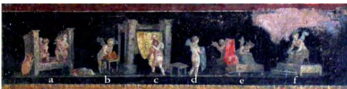
Fig. 1: Casa dei Vettii (VI 15, 1.27), oecus q , paroi est. Après avoir été foulé aux pieds (a), une pièce d'étoffe est frottée à la main (b). Elle est ensuite peignée (c), avant d'être soumise à une vérification (d-e) puis pliée (f).

La séquence proposée par les sources littéraires est lacunaire et inachevée. Il est possible de la compléter par le biais des représentations du foulage provenant de Pompéi provenant de la Casa dei Vettii (VI 15, 1.27) et de la fullonica de L. Veranius Hypsaesus (VI 8, 2.20-21). La première fresque (fig. 1) permet de résoudre la question du peignage : la brosse est passée sur les vêtements après le foulage ; elle sert donc à préparer l'éventuel lustrage sous presse qui n'est pas montré ici. La seconde représentation (fig. 2) comble cette lacune. Une lecture de bas en haut puis de haut en bas montre la succession des opérations : foulage au pied, peignage et soufrage, pressage