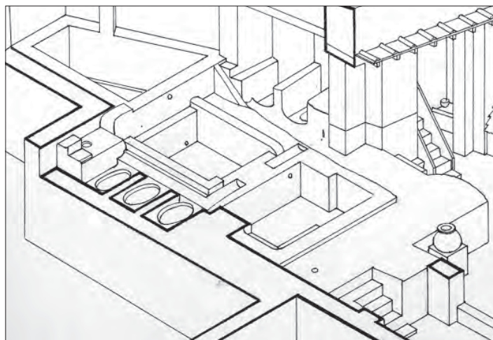
Fig. 4: Représentation isométrique des bassins et des stalles de la fullonica de Stephanus (I 6, 7) (dessin Soprintendenza Archeologica di Pompei , inv. n°P632). Si le premier bassin trapézoïdal n'est qu'une réserve inaccessible aux foulons, il participe néanmoins à la circulation de l'eau en continu. Le volume cumulé des trois bassins est de 9261 litres.

Cet essai de combinaison entre les différents types de sources concernant la foulerie semble concluant du point de vue de l'histoire technique : il a permis de restituer les différentes activités dans ces ateliers et, en retour, de mieux comprendre les vestiges mis au jour. Un risque subsiste toutefois. Celui d'offrir une description technique plus qu'une histoire des techniques. Il serait donc nécessaire de rechercher l'évolution de ces pratiques au-delà des cités ensevelies par Vésuve.