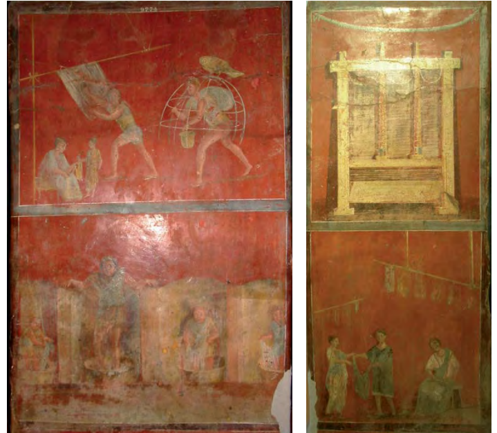
Fig. 2: Fullonica de L. Veranius Hypsaesus (VI 8, 2.20-21), extrémité est du péristyle, pilier nord, faces sud (à g.) et est (à dr.) (MANN, inv. n°9774). En bas de la face sud, quatre foulons manipulent le linge dans des stalles pourvues de bassines métalliques. En haut, trois étapes sont représentées: le peignage, le soufrage et une probable vérification avant reprise des étoffes. Sur la face orientale, une presse à vêtements à deux vis, appareil destiné au lustrage a été peint. En dessous, le client reçoit son linge nettoyé.

puis retour du linge au client. L'application de cette séquence aux aménagements découverts à Herculanium et Pompéi permet de mieux comprendre leur intérêt.