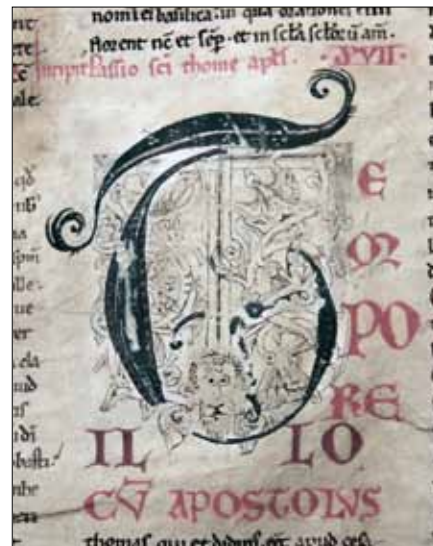
16 - Dijon, Bibliothèque Municipale, ms 642, f. 40.

31. Guillaume de Malmesbury, Gesta rerum anglorum , p. 380-385.