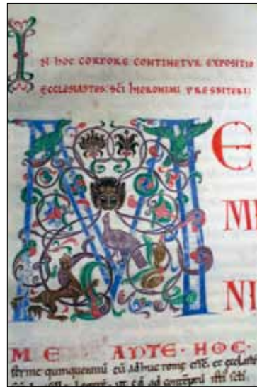
18 - Dijon, Bibliothèque Municipale, ms 132, f. 191.