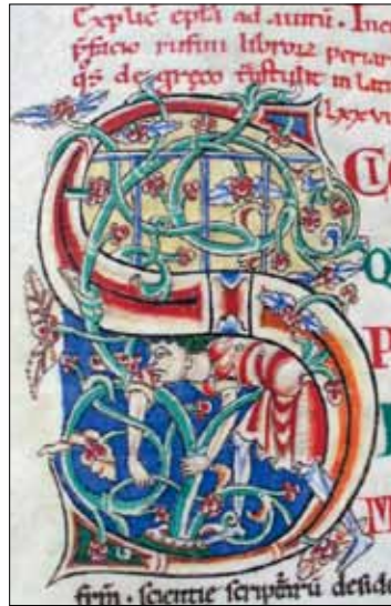
13 - Dijon, Bibliothèque Municipale, ms 135, f. 114v.

(ms 15, f. 68) est un modèle attesté uniquement en Angleterre 21 . La harpe du roi David (ms 14, f. 13v, [ill. 4]) serait aussi d'une forme connue dans les Îles britanniques 22 . À ces remarques, on pourrait ajouter le système de notation inscrit sur l'orgue d'un des musiciens de David : il s'agit du système des lettres utilisé dans les pays anglo-saxons (C, D, E, etc.) différent de celui introduit par Guido d'Arezzo (Ut, Re, Mi, etc.) et utilisé en France au début du XII e siècle. L'enlumineur semble connaître également des manuscrits réalisés dans les Îles Britanniques. Selon une proposition convaincante de C. Treat Davidson, le ruisseau et les oiseaux de l'initiale Q au début du 35 e chapitre des Moralia (ms 173, f. 174) s'inspireraient de ceux du mois d'octobre de quelques calendriers anglo-saxons du XI e siècle (Londres, BL, Cotton Tiberius B. V, f. 7v; Cotton Iulius A. VI, f. 7v) 23 . Enfin, selon Walter Cahn, l'insertion de l'image d'Arius au début de l'Évangile de Jean dans la Bible d'Étienne Harding (ms 15, f. 56v) s'inspirerait de l'évangélaire d'Eadwius, enluminé à Canterbury aux environs de 1020 24 .