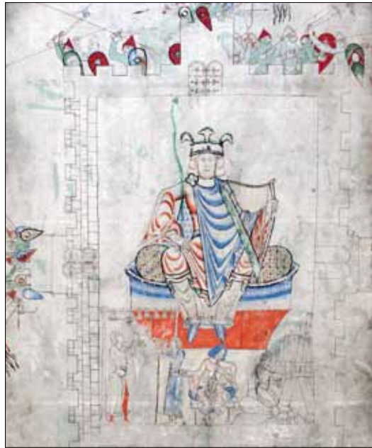
4 - Dijon, Bibliothèque Municipale, ms 14, f. 13v.