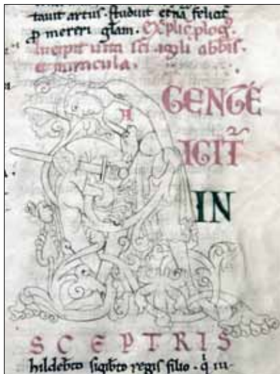
14 - Dijon, Bibliothèque Municipale, ms 642, f. 58.