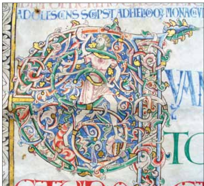
8 - Dijon, Bibliothèque Municipale, ms 135, f. 2v.