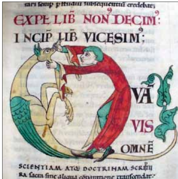
6 - Dijon, Bibliothèque Municipale, ms 173, f. 29.