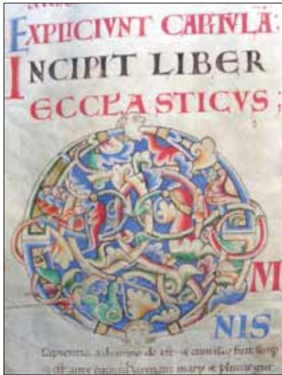
9 - Dijon, Bibliothèque Municipale, ms 14, f. 136v.