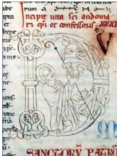
15 - Dijon, Bibliothèque Municipale, ms 642, f. 65v.