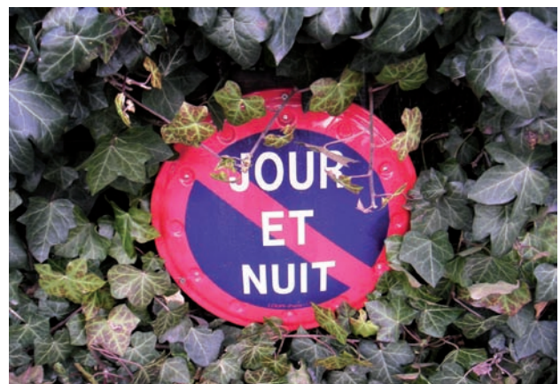
24 h / 24