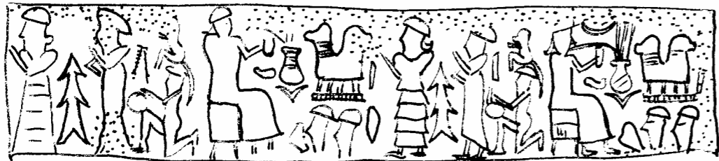
Fig. 16 : FT 3A, seals A-C.