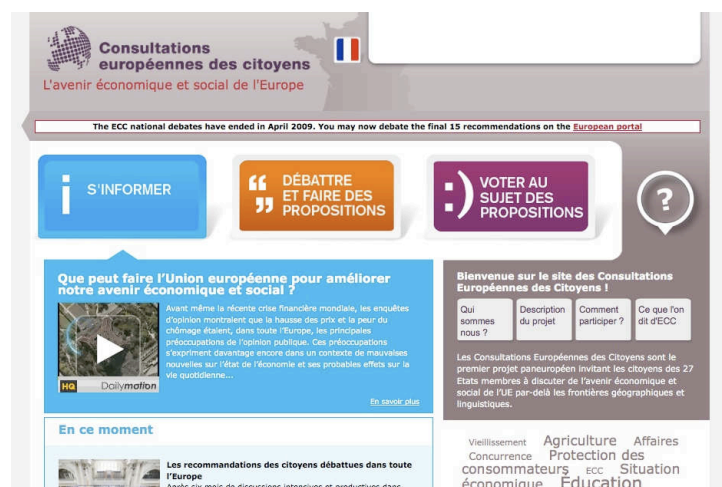
Figure 1. Page d'accueil du site français de la Consultation Européenne des Citoyens

La procédure consultative se structure autour de trois séquences : un moment d'information, où les participants ont accès à divers documents relatifs à la consultation, un moment d'échange, au sein de forums où les participants peuvent créer des fils de discussion, poster des messages au sein de fils existants et transformer un message en proposition, et un moment de vote, où ils expriment leurs préférences quant aux propositions formulées dans les forums. Cette « séquentialisation » de la participation correspond à une « méthode consultative » mise en place par La Netscouade et expérimentée dans des contextes très différents. La procédure en ligne de la CEC correspond en quelques sortes à un « modèle standard » de consultation, dont ces trois séquences constituent les fondements.