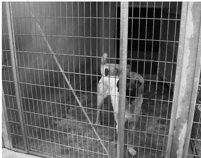
Figure 3 : Box occupé, vu de face (J. Michalon)

la pièce à proximité d'un grand congélateur où sont entreposés les cadavres attendant d'être emportés à l'équarrissage. Lieu du soin, l'infirmerie est aussi celui de la mort médicalisée des animaux, puisque l'on y pratique les euthanasies.