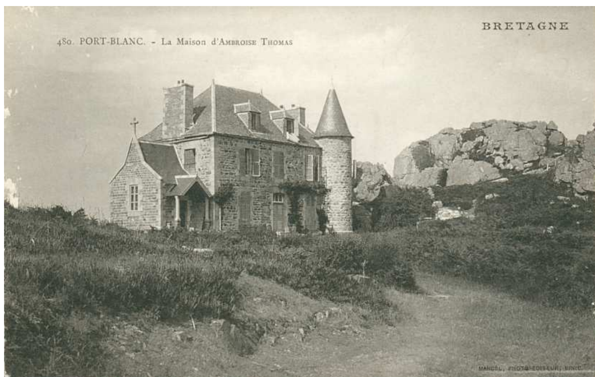
« Château d'Ambroise Thomas », sur l'île Illiec, à Buguelès. La chapelle est le petit bâtiment surmonté d'une croix.

La demeure est finalement acquise en 1938 par... l'aviateur Charles Lindbergh, désireux de retrouver le calme dans cet endroit retiré, après le tragique enlèvement et l'assassinat de son fils 128 . Pendant la seconde guerre mondiale, la maison, située en un endroit stratégique, est occupée militairement par les Allemands, puis, étant propriété d'un ressortissant américain en guerre avec le Reich, est intérieurement complètement détruite. Après la Libération, la statue de saint Yves de Vérité réapparaît au grand jour dans la vitrine d'un ébéniste antiquaire de Tréguier ayant travaillé à la rénovation d'Illiec... lequel n'est autre que le petit-fils de celui qui avait acheté les pierres de l'oratoire de Trédarzac trois quarts de siècle plus tôt 129 . L'ayant exposé dans la devanture de son atelier... il constate – non sans