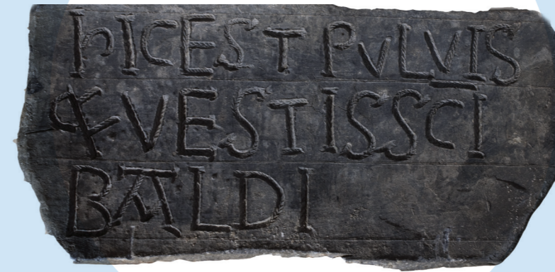
Inscription funéraire pour saint Bauld, XI e -XII e siècle. Trouvée lors de fouilles, cette lame de plomb de petite taille, dont les lettres ne mesurent qu'1,3 cm de hauteur, devait se trouver à l'intérieur de la sépulture.

L'écodotique (l'édition de textes anciens) repose sur un double principe : le respect du texte à publier et la responsabilité de l'éditeur. L'édition n'est pas une transmission neutre, mais un