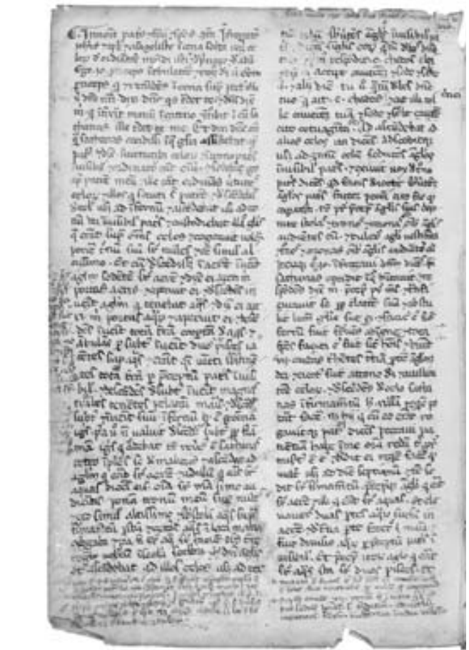
Interrogatio Iohannis, (manuscrit 1137, Bibliothèque Nationale d'Autriche, f°158v).

En effet, le contenu du livre est très proche des croyances des Bogomiles, hérétiques dualistes apparus en Bulgarie au Xe siècle, puis répandus dans l'empire byzantin et dans des pays balkaniques, en particulier en Bosnie. La ressemblance de l'Interrogatio est singulièrement marquée avec l'enseignement