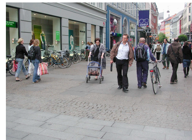
Rouler, pousser, tirer, glisser... : de nouvelles manières de bouger en ville ?

L'exigence quasi hygiéniste de la neutralisation des odeurs dans les espaces publics – ou à l'opposé l'impératif marketing de la « signature olfactive » des lieux – bouleversent davantage les manières d' « être-ensemble » en public. En lissant les ambiances olfactives, ces principes conduisent à une fadeur généralisée du cadre de vie et à une atonie de notre perception olfactive (Balez, 2001). Un tel constat donne du crédit à la thèse de Simmel sur « l'émoussement des sensibilités » au cours des siècles et du raffinement des cultures urbaines. Mais il rend aussi manifeste la tendance actuelle à l'hyperesthésie des sociabilités