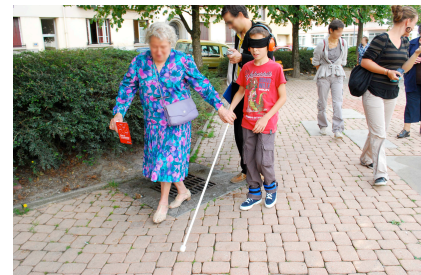
Bandeau et casque occultants Lests de jambes

Pour chacun de ces protocoles, il était demandé aux personnes de prêter attention à leurs gestes, à la manière dont leur corps était mobilisé par leurs actions, la présence d'autrui et/ou les ambiances urbaines. Chaque groupe de parcourant était filmé par deux enquêteurs, à l'aide de caméras numériques. Le premier, immergé au sein du groupe, filmait les interactions entre participants. Le second, situé à l'extérieur du groupe, filmait en plan large son mode d'occupation dans l'espace. À l'issue de chaque parcours, les participants étaient invités à partager leurs impressions au cours d'une séance de « retour d'expérience ». Plus que la situation de handicap elle-même, il s'agissait de verbaliser ce que l'ambiance « fait à mon corps », en quoi et comment elle brouille mes impressions, quelles « techniques » elles requièrent de ma part.