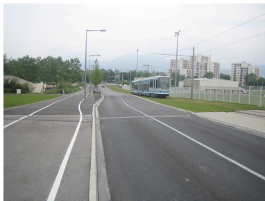
« Etanchéification » des flux

« pédibus » aux abords des écoles... Cette volonté affichée d'un apaisement de la mobilité urbaine s'accompagne d'une transformation des conditions même de circulation en ville. Nombreuses sont ainsi les municipalités qui élargissent le périmètre de leurs espaces piétons, « étanchéifient » les flux de déplacement, sécurisent les déplacements à l'aide de revêtement de sol ou de mobilier urbain adéquats, travaillent la lisibilité de leur signalétique... Dans le même temps, et au nom du principe de « durabilité », la grande ville se « végétalise » : implantation de « coulées vertes » le long des lignes de tramway, institution de « plans de fleurissement » lors d'opérations de requalification... sont censés embellir le cadre de vie et apaiser les tensions de la vie urbaine.