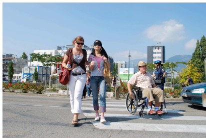
Bandeau occultant Fauteuil roulant manuel