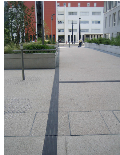
Un lissage et un marquage podo-tactile renforcés