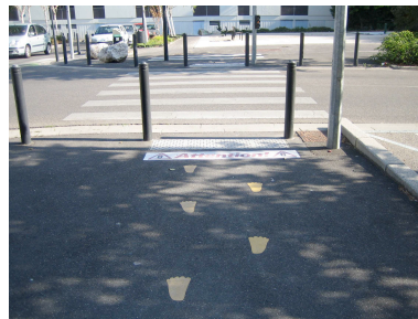
« Sur-signalisation »