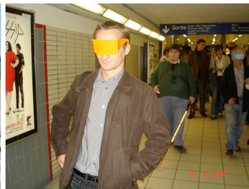
Lunettes de simulation de la malvoyance