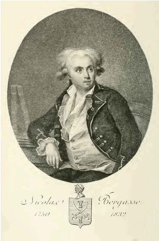
Portrait de Nicolas Bergasse, en L. Bergasse, Un défenseur, cit.