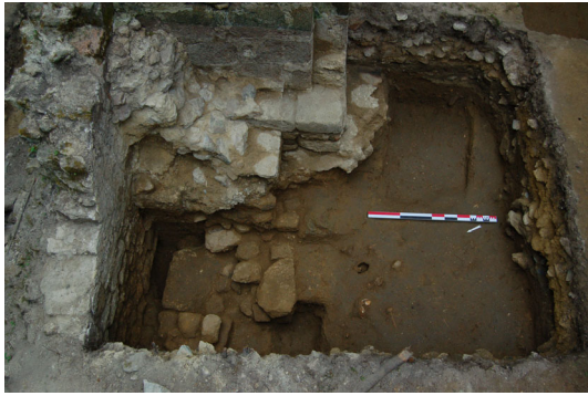
Fig. 2 - Saint-André-des-Eaux, vue de l'autel secondaire depuis l'ouest (cl. M. Dupuis).